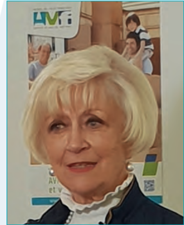
AVF... vous connaissez ?

D'autres suivront pour relater l'actualité nationale, régionale et locale et ainsi réduire les distances entre les différents niveaux de notre réseau grâce à cette nouvelle proximité audiovisuelle .