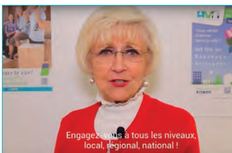
Appel à candidatures

Mais, pour autant, ils sont le garant d'un passage de relais nécessaire pour se remettre en question, innover, imaginer... et rajeunir !