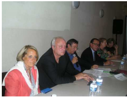
9 octobre - Assemblée générale AVF Vue de la tribune avec le bureau et les personnalités