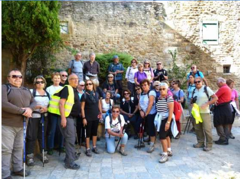
24 septembre - Randonnée c'est par une belle journée que les randonneurs du jeudi se sont remis en marche en douceur dans le Gard entre Serhnac et Meynes

Dans une ambiance conviviale, nous avons pu admirer des ouvrages anciens du XVIII siècle, commentés par le personnel accueillant du Musée.