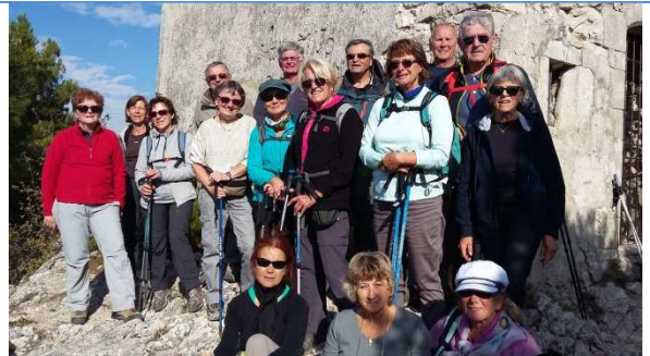
16 octobre – randonnée à SEURET, Monastère de PREBAYON et Notre dame d'AUBUSSON