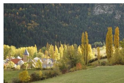
L'ARBRE ET LA FORET