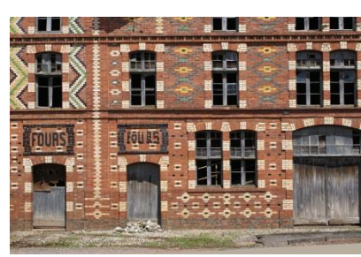
LES TRACES DU TEMPS