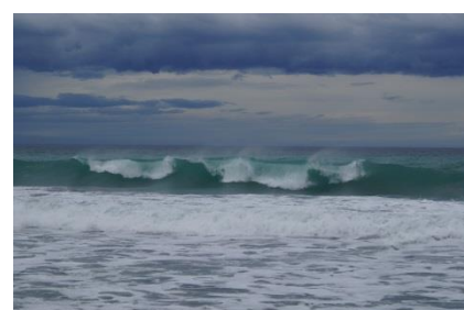
RACONTE -MOI LA MER