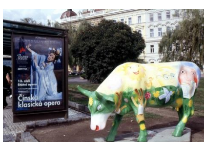
VACHES DES VILLES ET DES CHAMPS