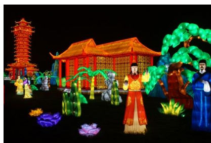
LES LANTERNES CHINOISES