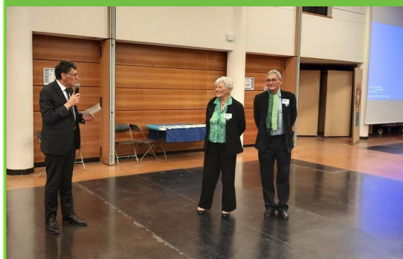
Les 40 ans de l'AVF Bourg-la-Reine Mr le Maire s'adressant aux coprésidents

À vos agenda : le prochain CA de l'IDF se tiendra le mardi 27 février 2024 en vidéo ou en présentiel à Paris