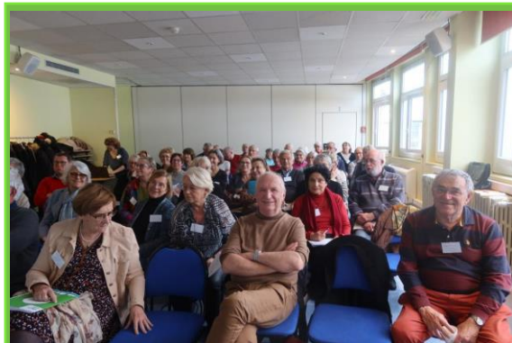
Les Assises en plénière

Le bureau de l'Île-de-France vous présente ses meilleurs vœux pour la nouvelle année et comme il n'y a pas que les AVF qui comptent, nous vous souhaitons également beaucoup de bonheur sur le plan personnel.