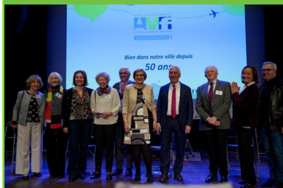
Les 50 ans de l'AVF Boulogne-Billancourt Mr le Maire et le Président de l'AVF