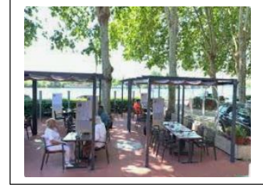
Resto le Mékong Conflans

NE RIEN REGLER avant d'avoir reçu confirmation de la disponibilité de places.