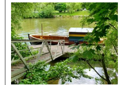
Bords de l'Oise