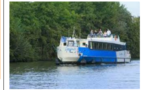
Croisière sur l'Oise