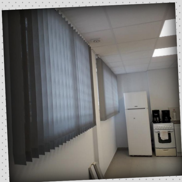
La preuve, joli résultat pour les stores de la cuisine !!