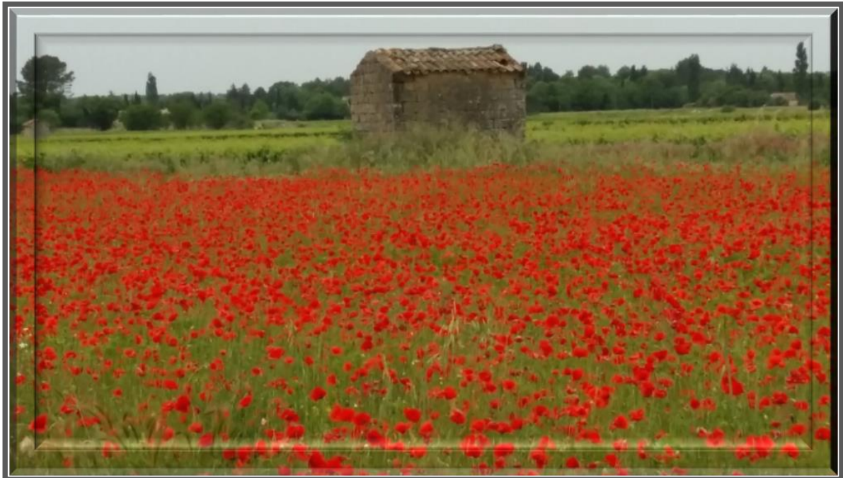
Champ de coquelicots sur la route de Montaren

Et n'oublions pas les jardins improvisés dans la nature