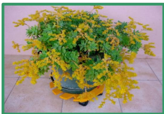
Sedum de Palmer

En témoignent ces clichés envoyés par des adhérentes qui invitent à déambuler parmi ces fleurs multiples et variées.