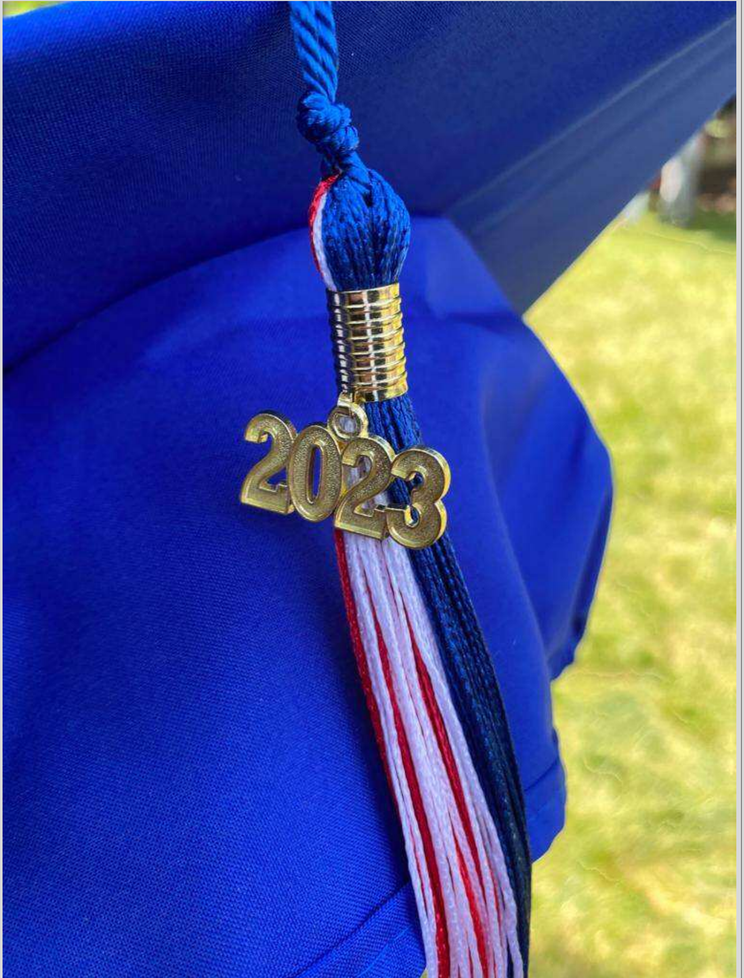
N° 8 – Mortier Hat Throwing de Tallulah