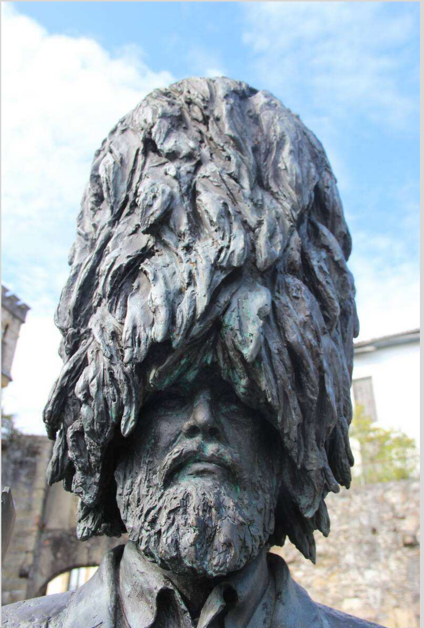
N° 6 – Hatxeroa à Hondarribia