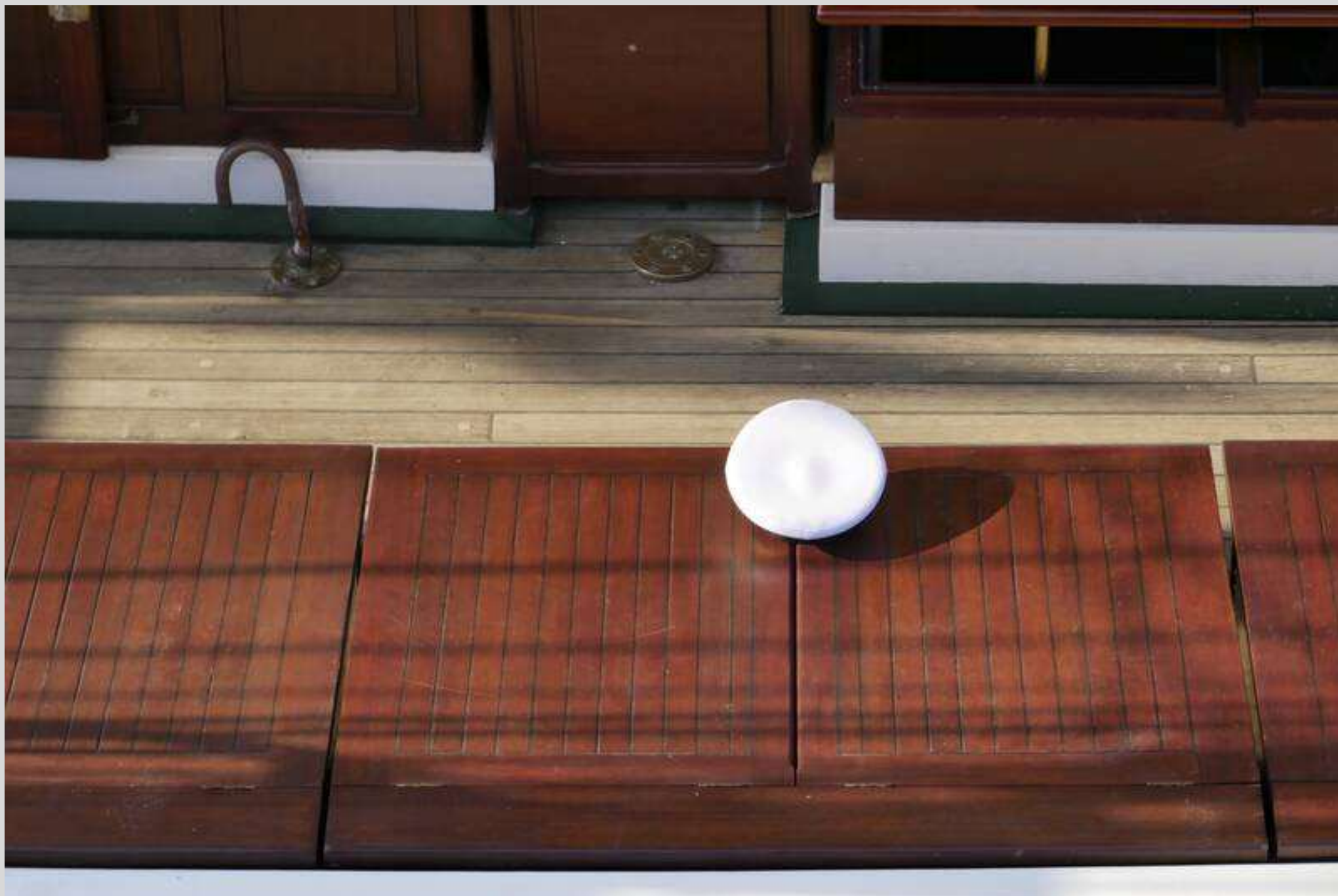
N° 1 – Marin disparu ?