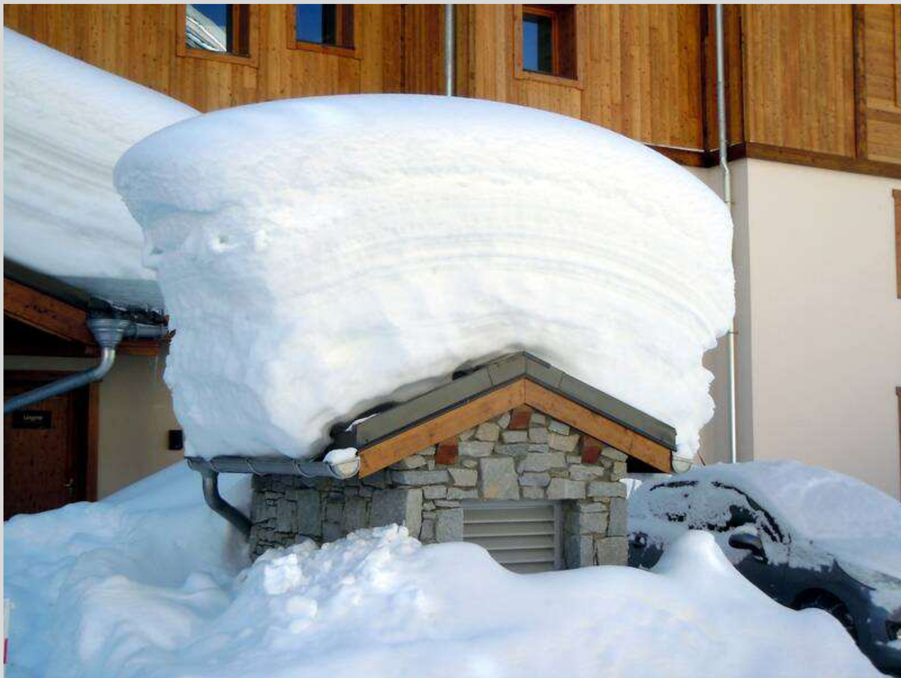
N° 3 -