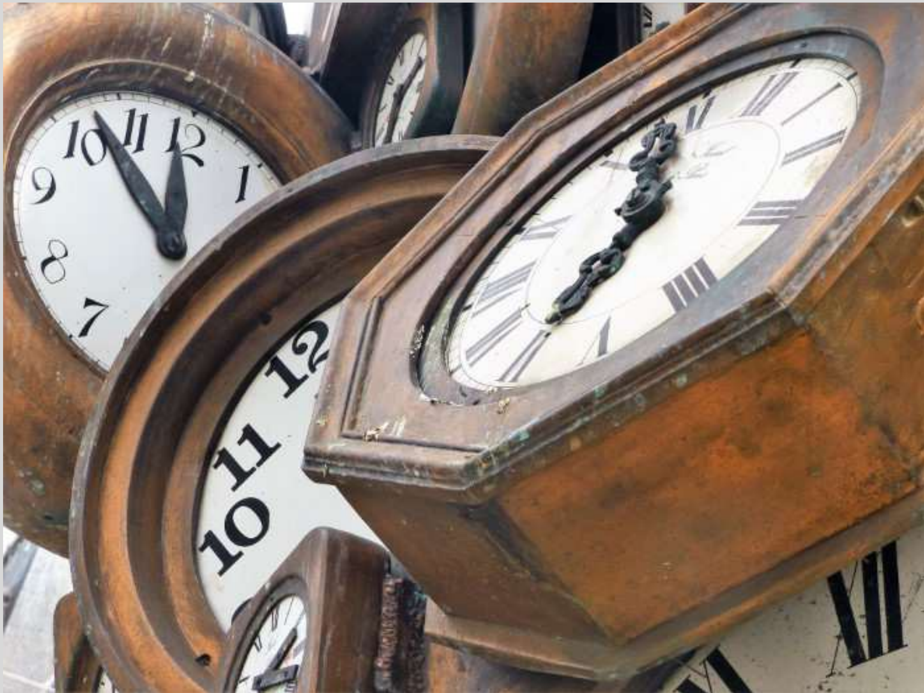
N° 3 – Gare Saint-Lazare, “L’Heure pour Tous” (Arman)