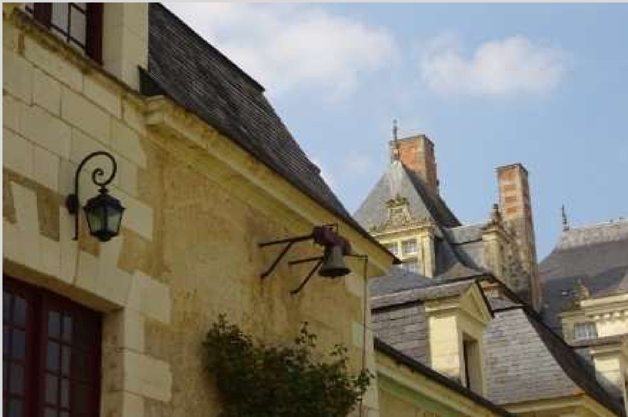
N° 4 – Il est l'heure de rentrer !