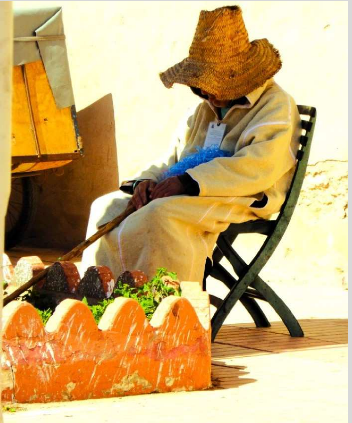
N° 8 – L'heure de la sieste à Essaouira