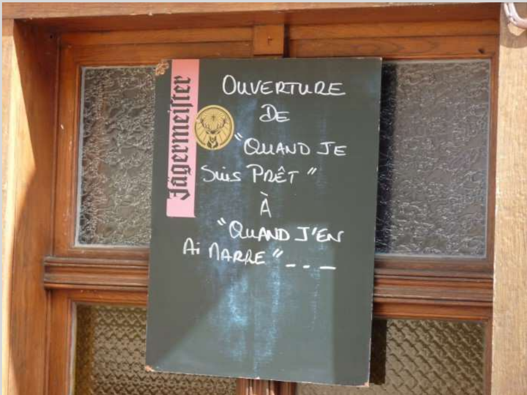
N° 2 – Petit pub en Loir-et-Cher