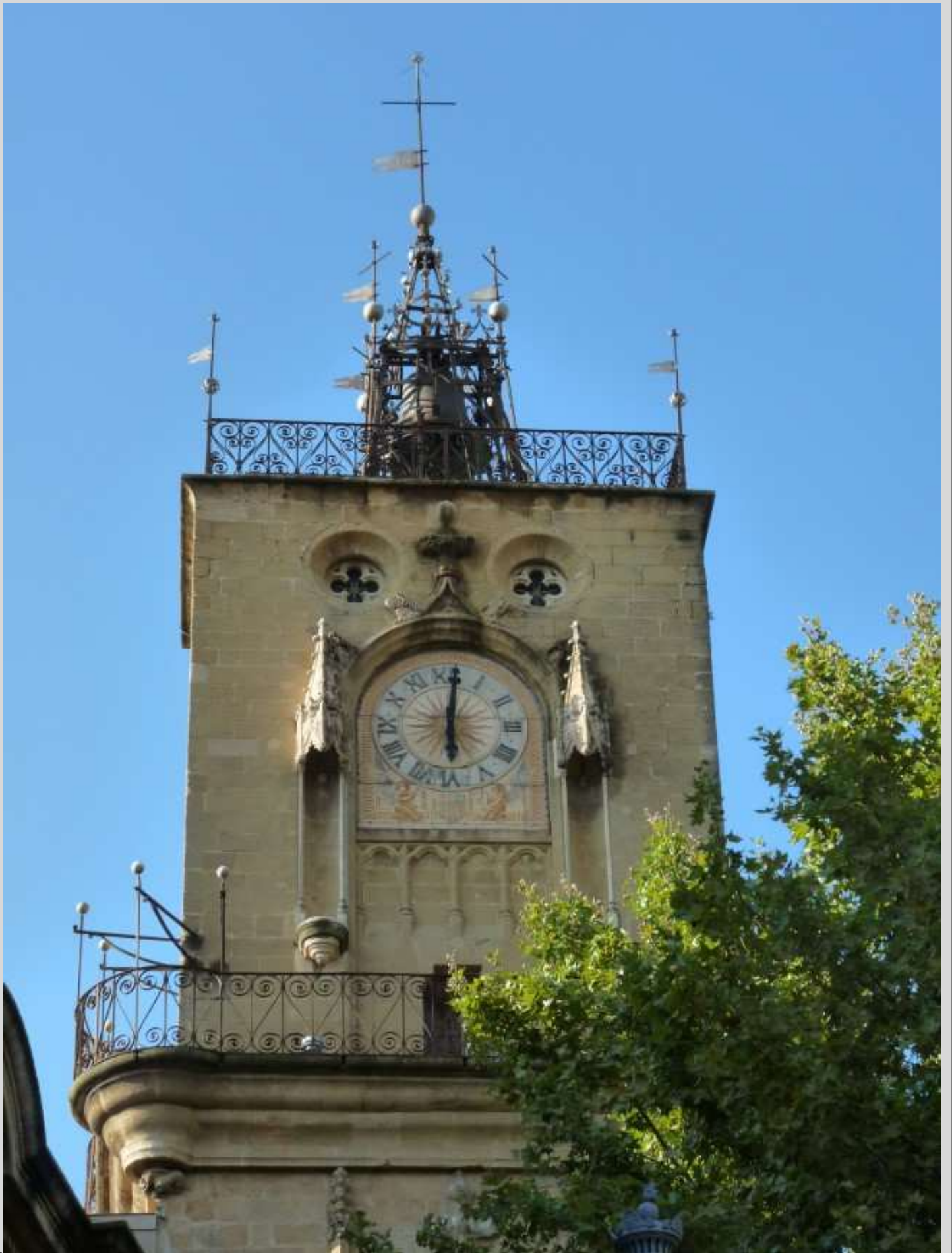
N° 7 – Tour de l'horloge de l'Hôtel-de-Ville, Aix-en-Provence