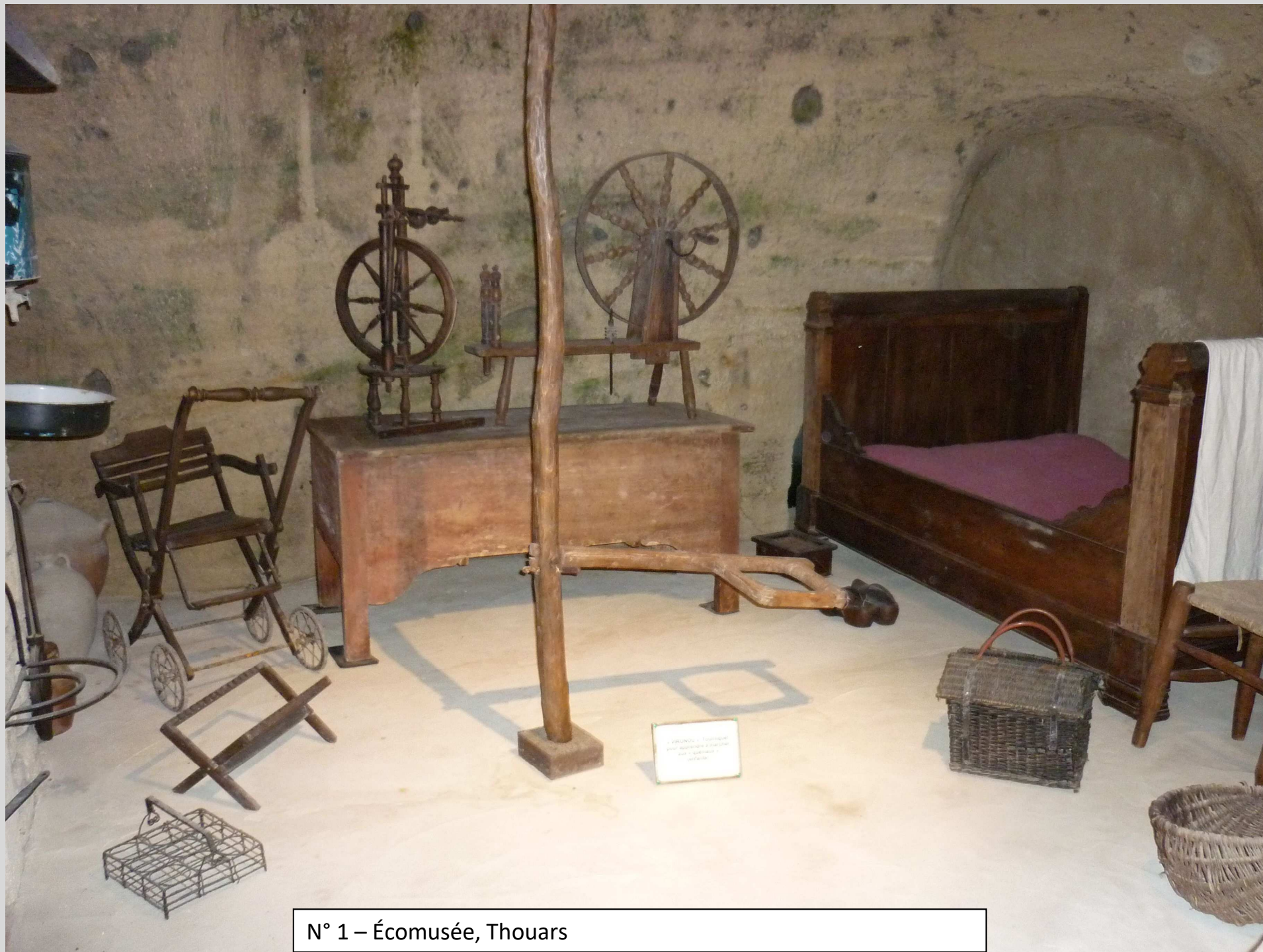
N° 1 – Écomusée, Thouars