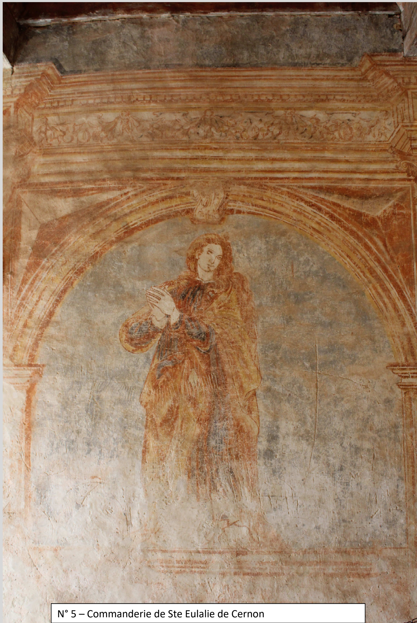
N° 5 – Commanderie de Ste Eulalie de Cernon