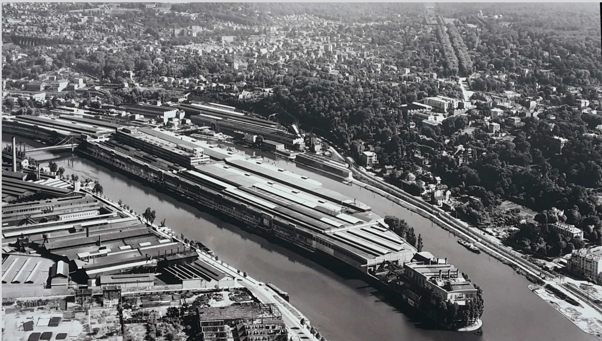
N° 4 – le passé industriel des Hauts-de-Seine