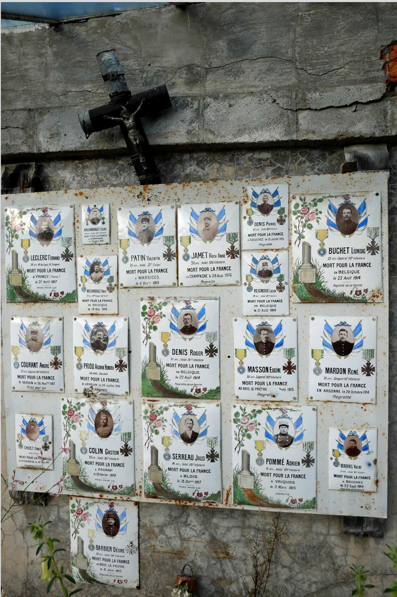
N° 7 – Cimetière, Mareuil-sur-Cher