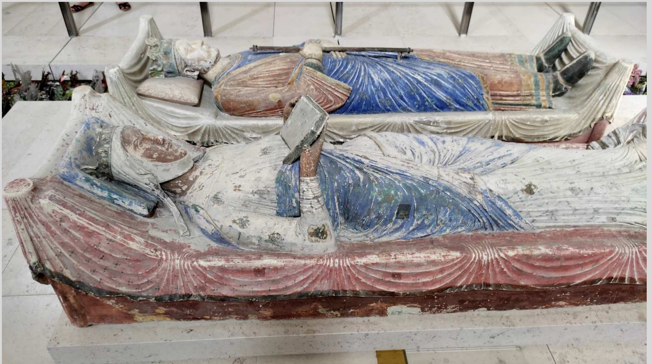
N° 2 – Fontevraud, gisants d'Aliénor d'Aquitaine et Henri II Plantagenêt