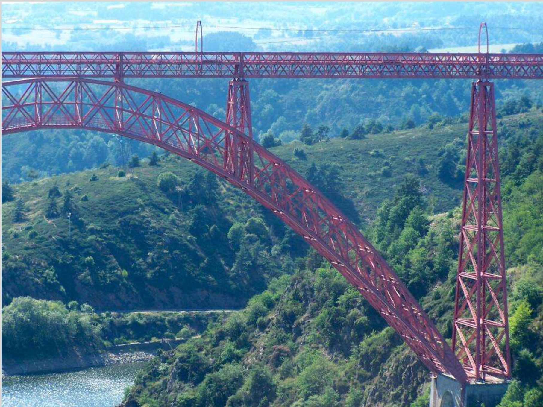
N° 1 – Garabit