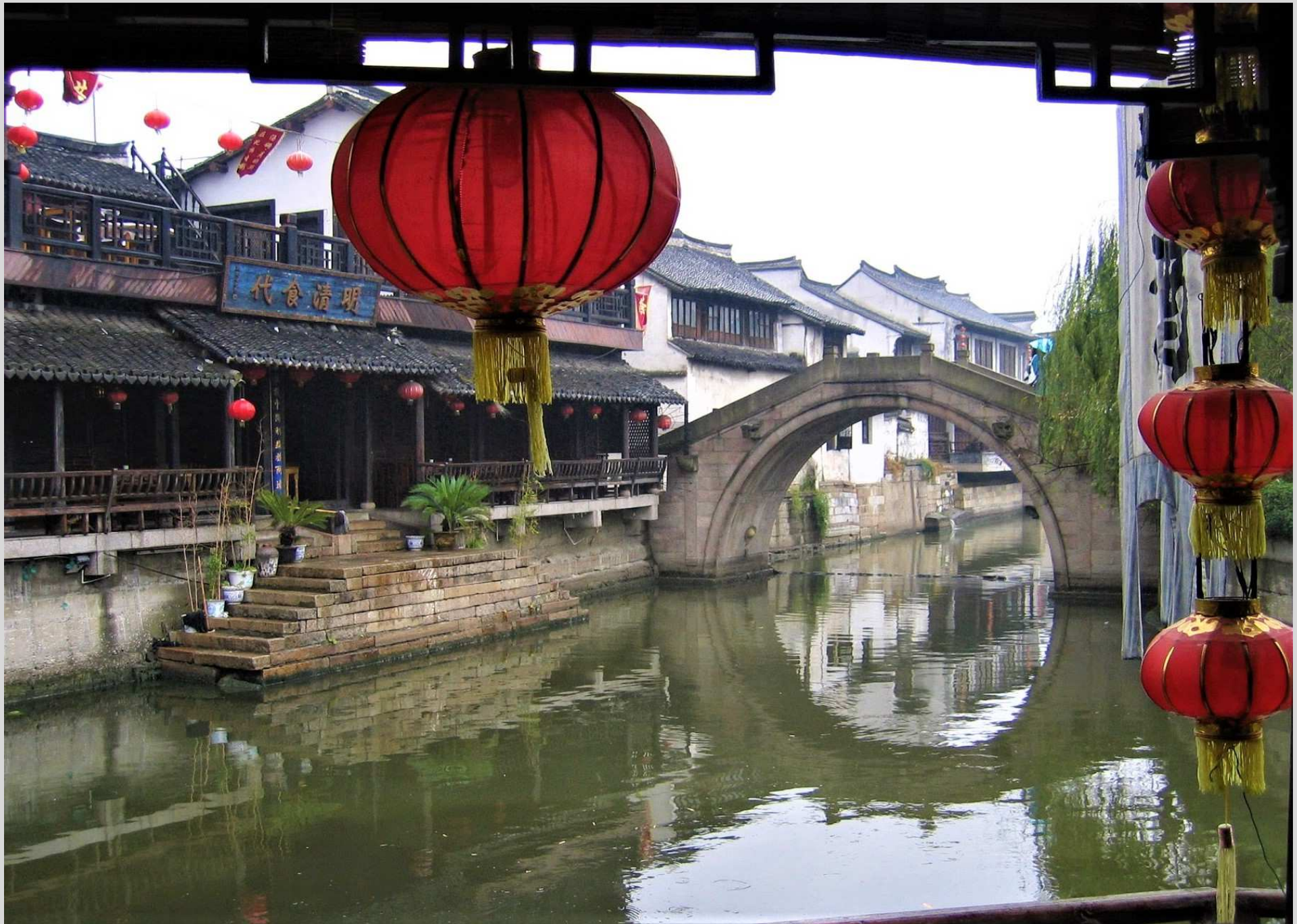
N° 3 – Suzhou, Chine