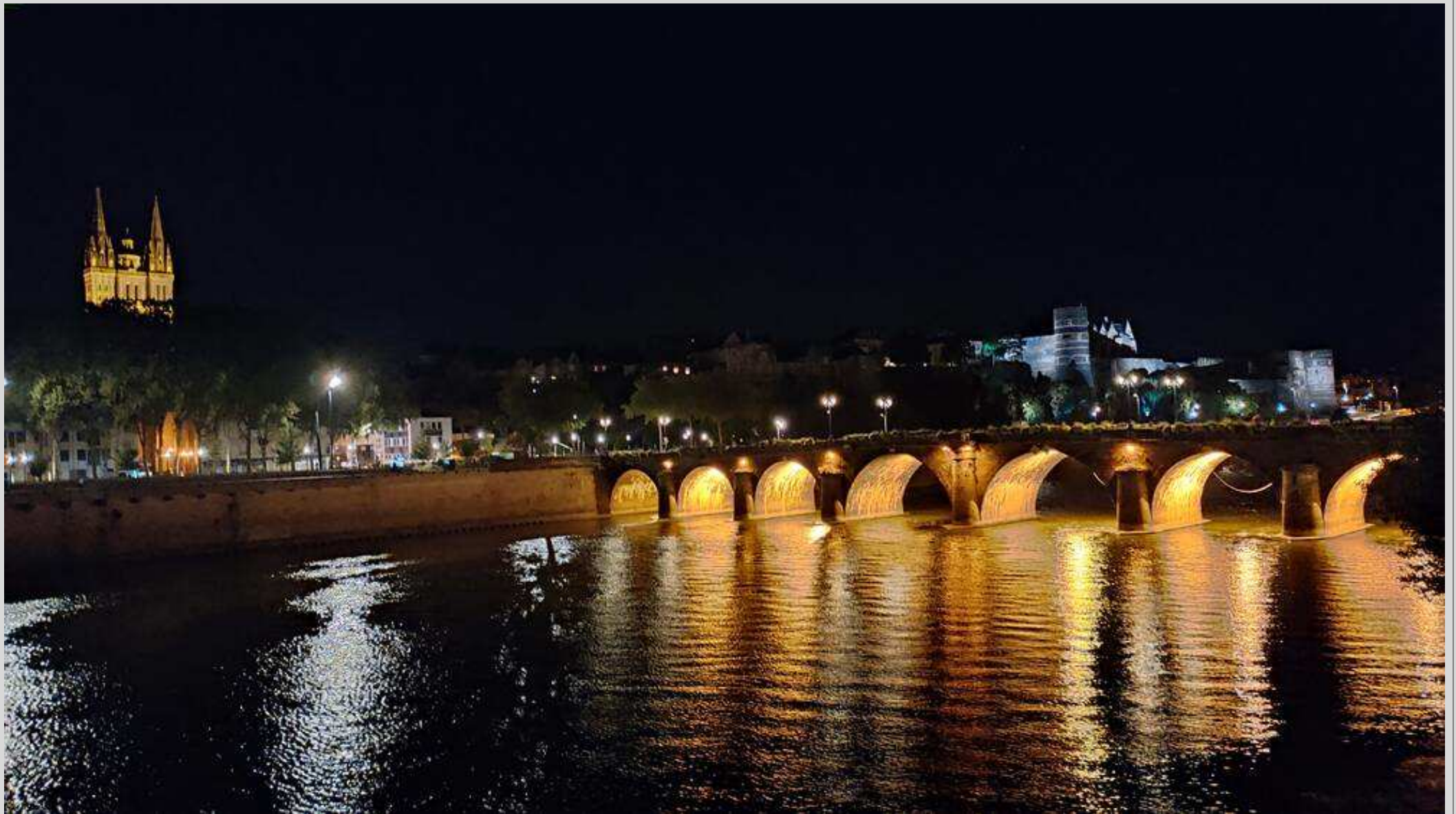
N° 6 – Angers, la Loire