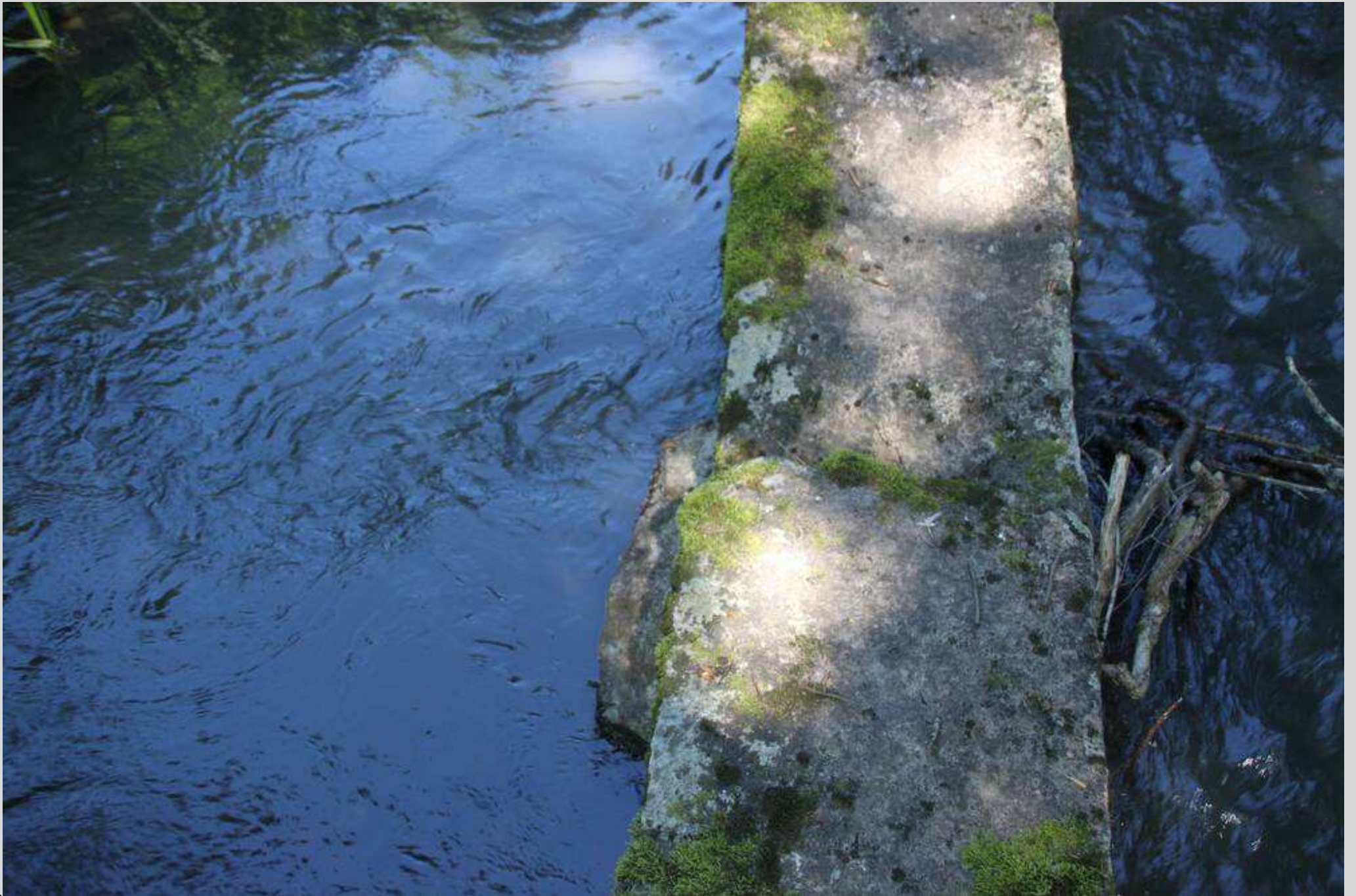
N° 5 – Inferneau