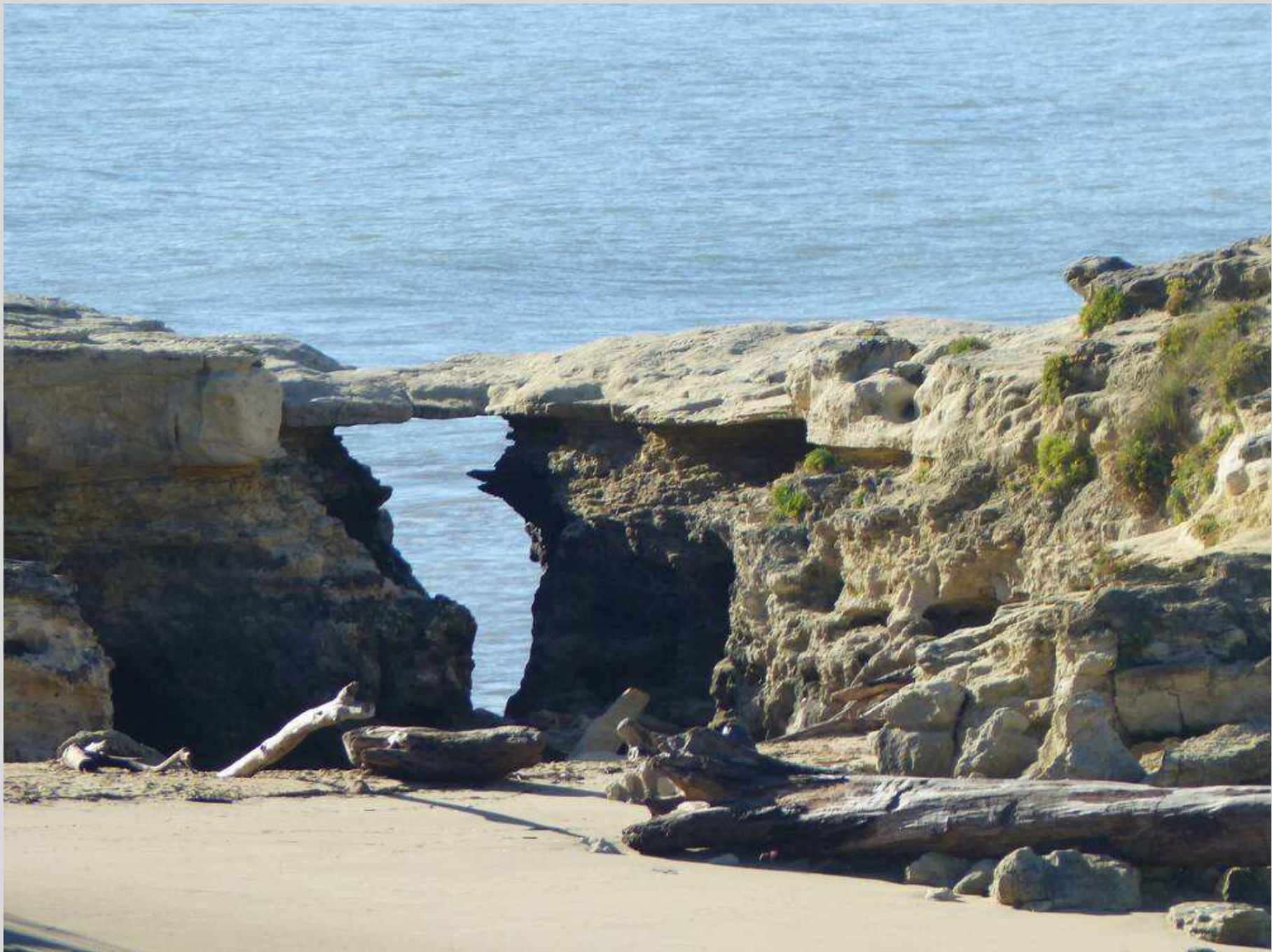
N° 4 – Saint-Palais