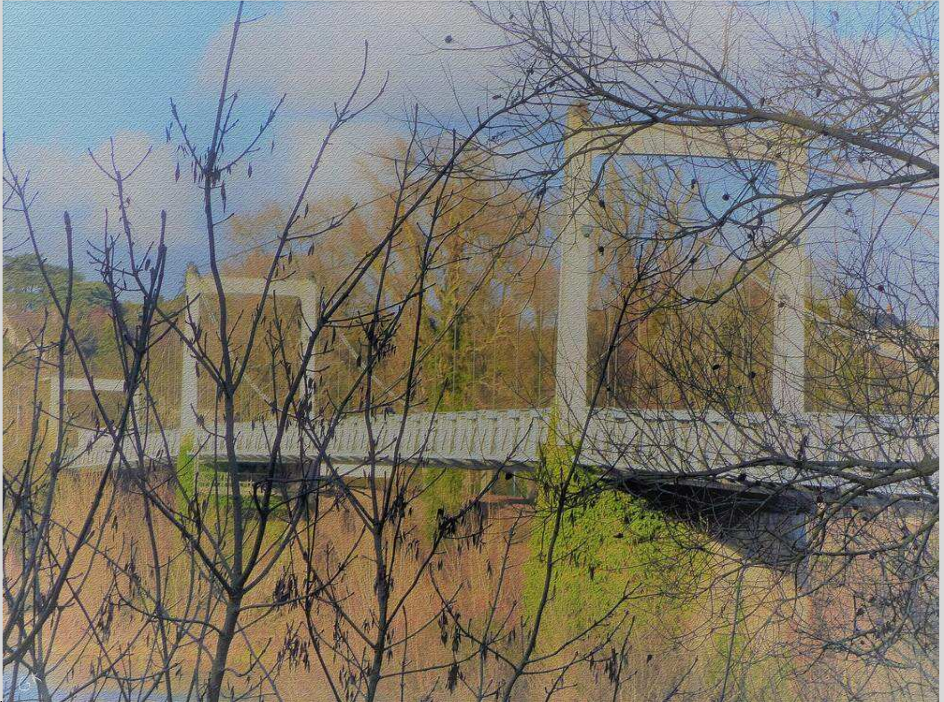
N° 8 – Un certain Pont de Fil