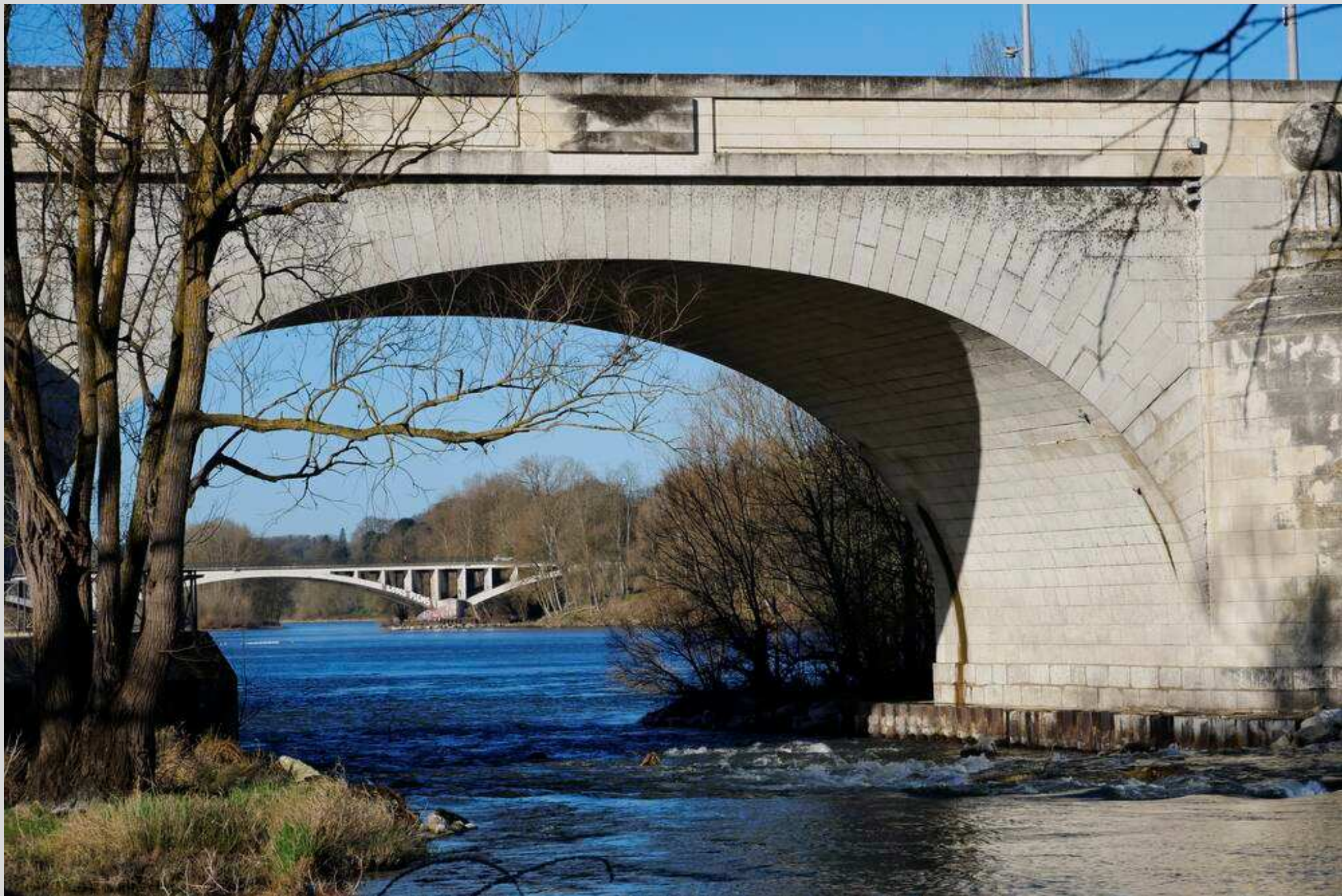
N° 7 – L'ancien et le moderne