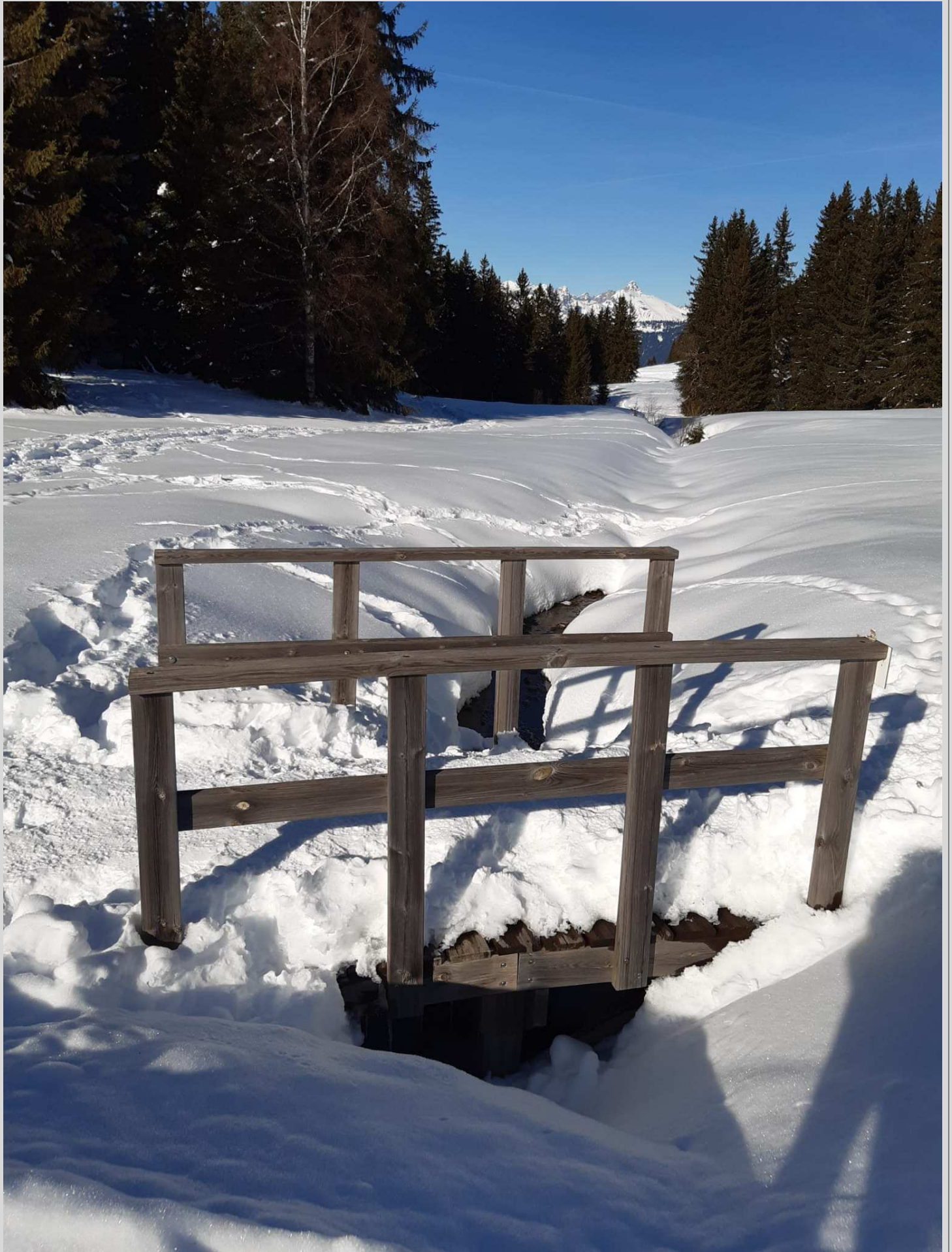
N° 11 – Un petit pont de bois...