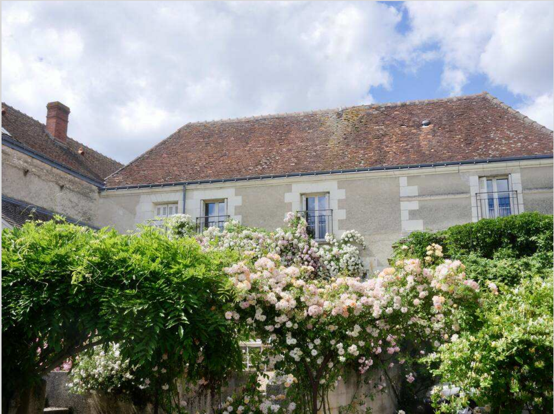
N° 5 – Chédigny, mais où est passée l'antenne ?!