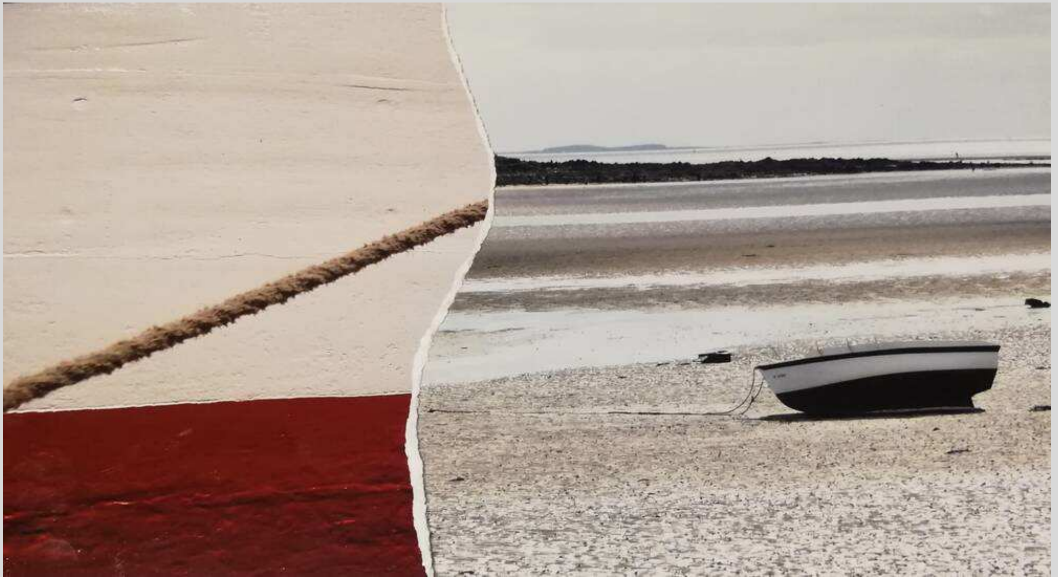
N° 1 – Mer déchirée