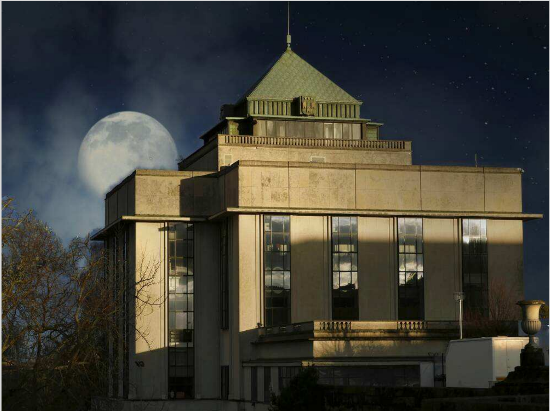
N° 3 – Lever de lune, coucher de soleil