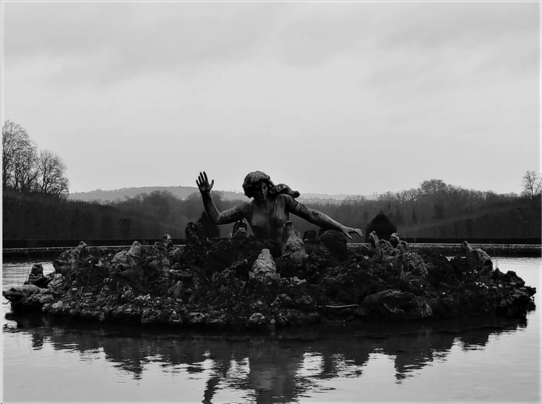
N° 1 – Château de Champs-sur-Marne