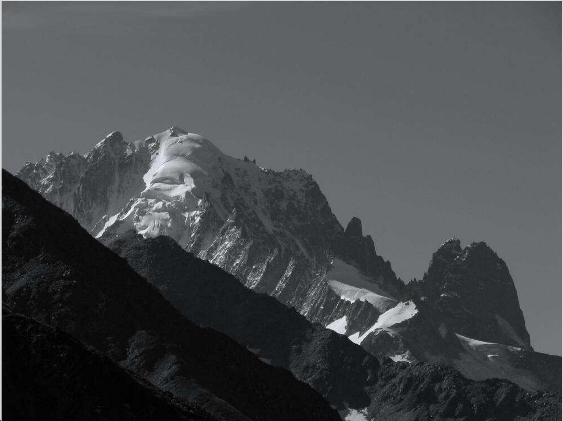
N° 7 – Aiguille Verte et les Drus - Chamonix