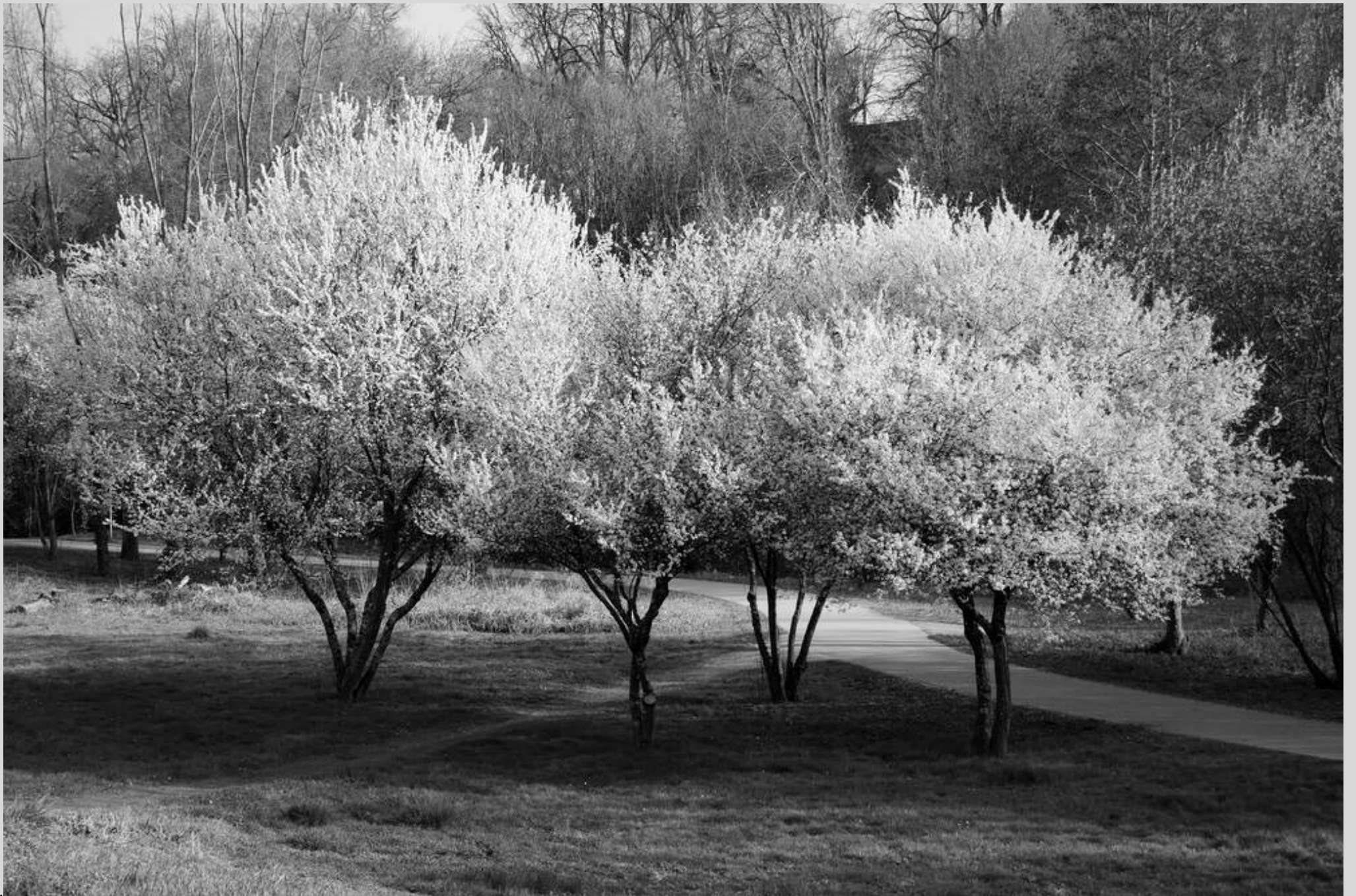
N° 5 – Bord du Petit Cher - Tours