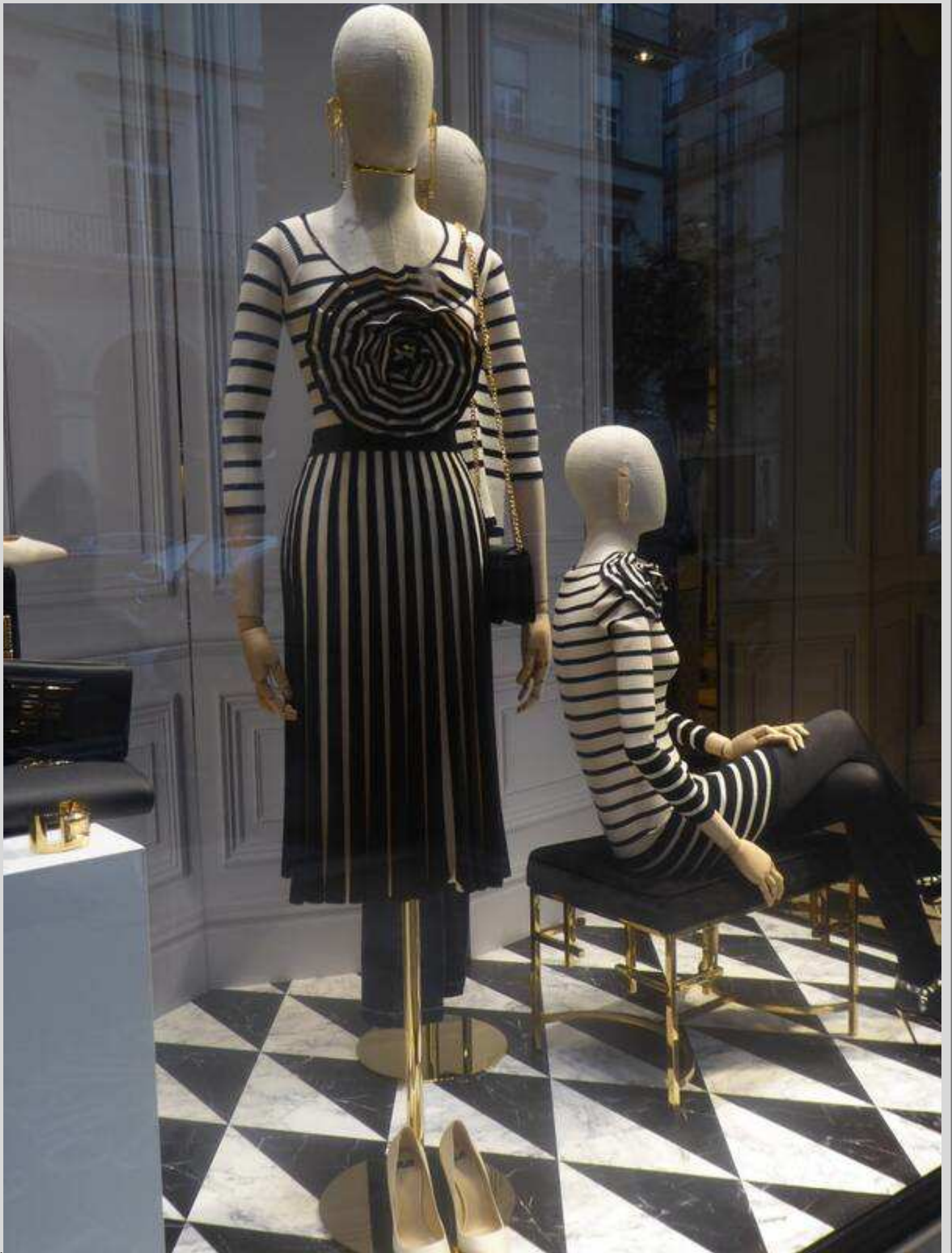
N° 8 – Vitrine italienne