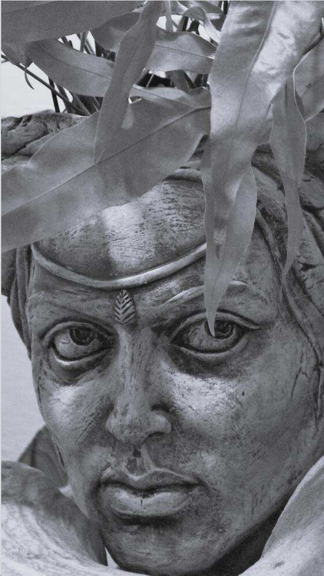
N° 9 – On m'observe dans la Habana Vieja - Cuba