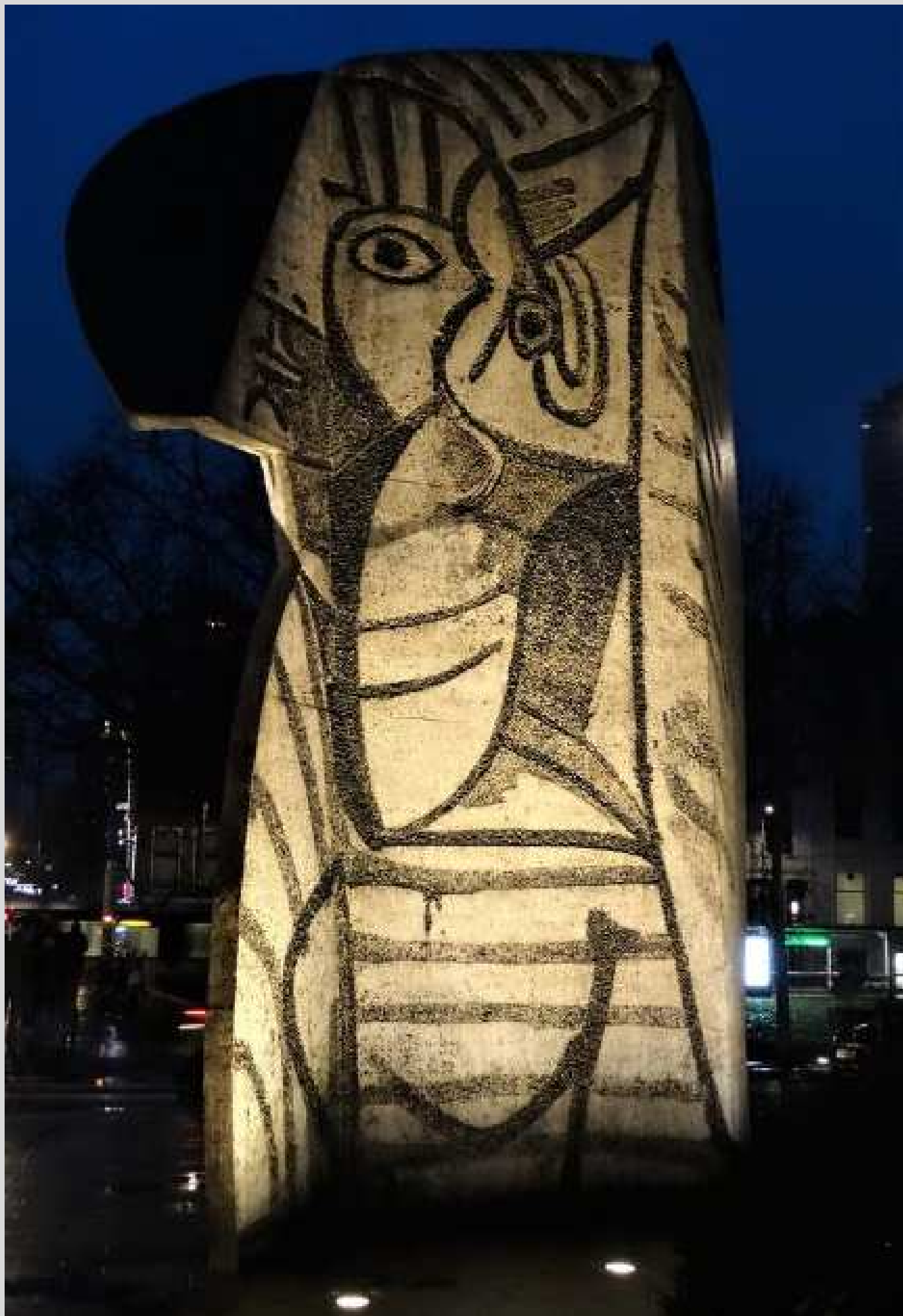
N° 10 – Rotterdam by night