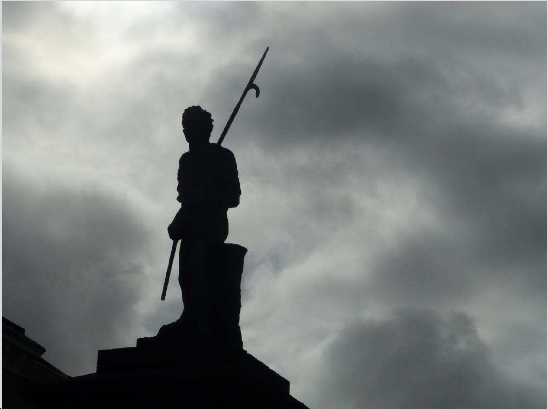
N° 2 – Irlande