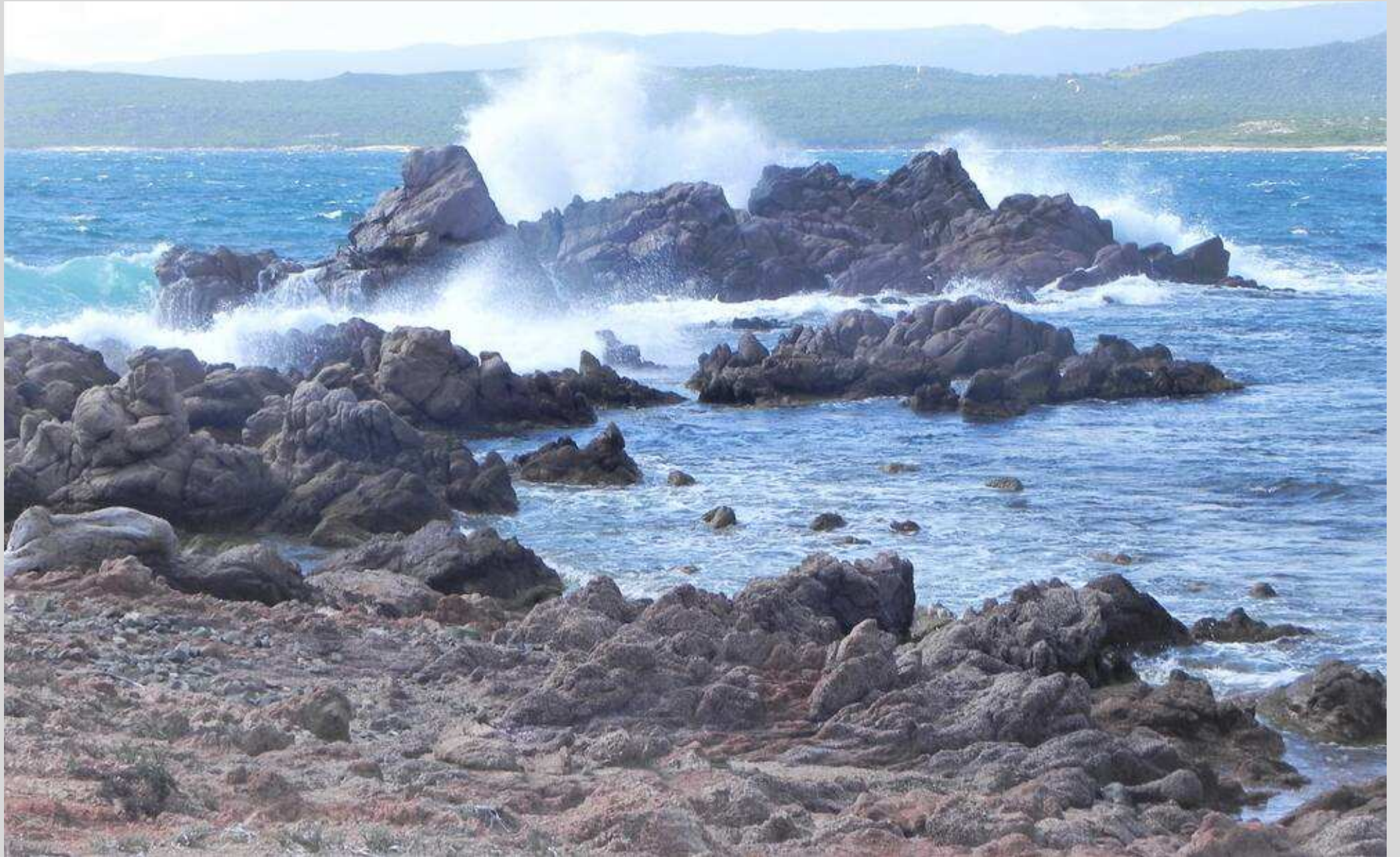
N° 1 – En Corse