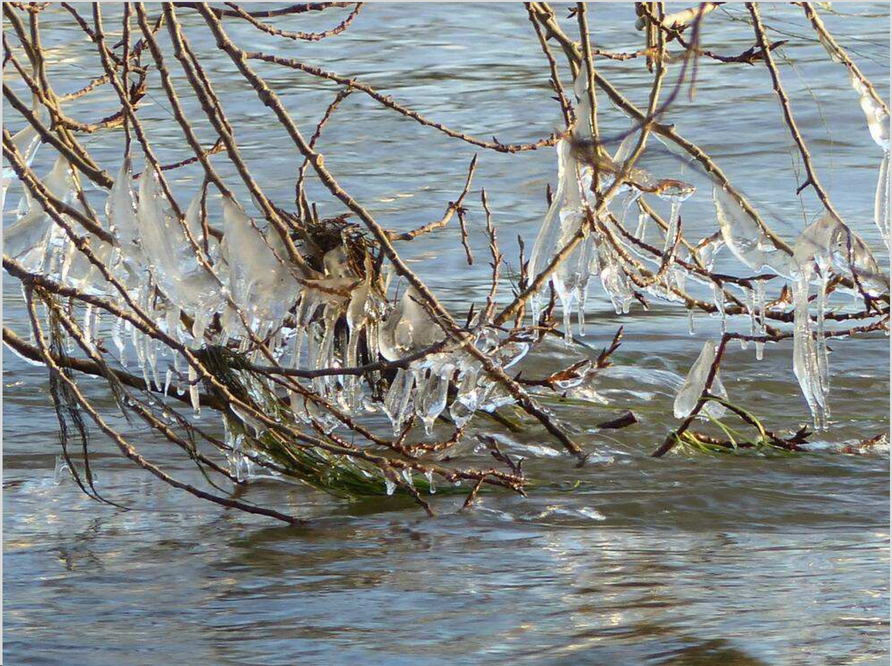
N° 3 – La Loire en hiver