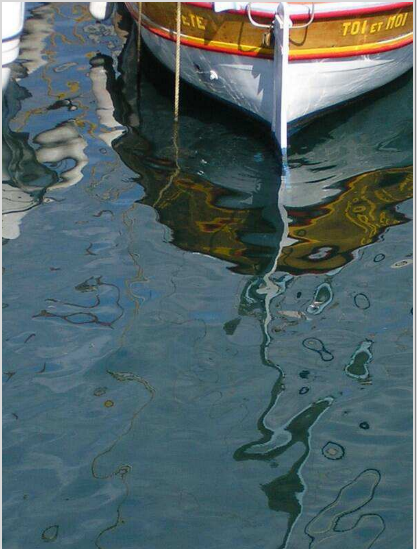
N° 9 – Reflets à Sète