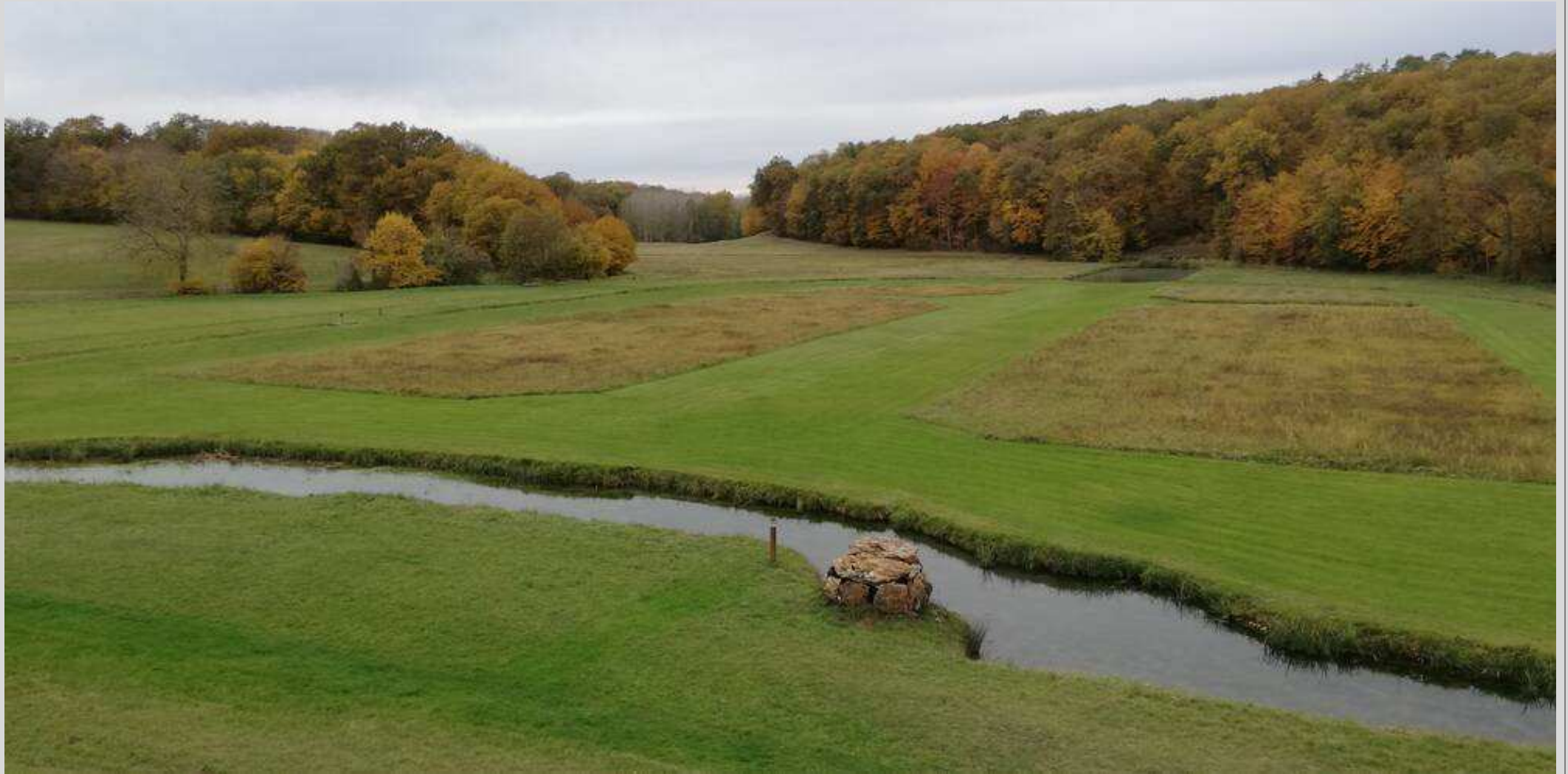
N° 7 – Au fil de l'eau à Montpoupon