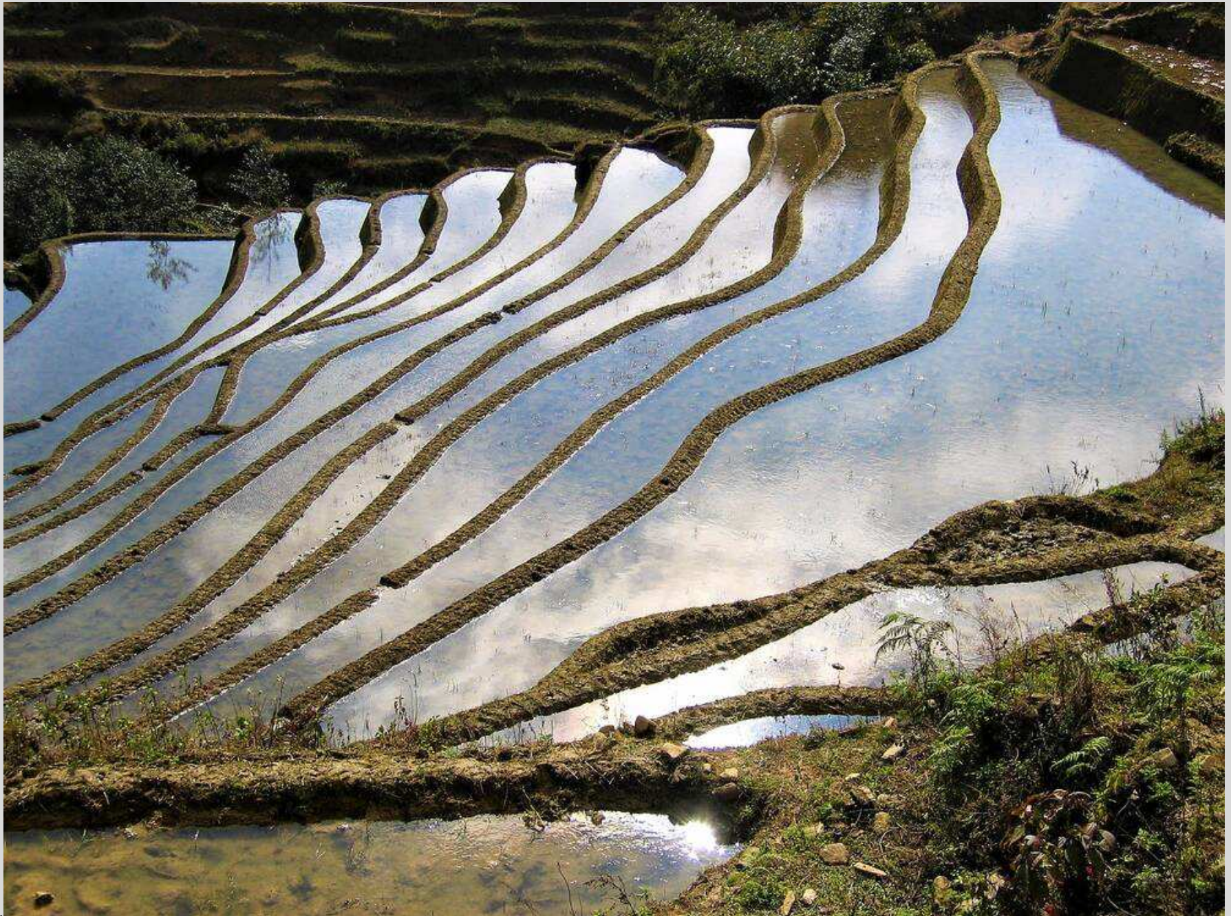
N° 2 – Rizières en Chine