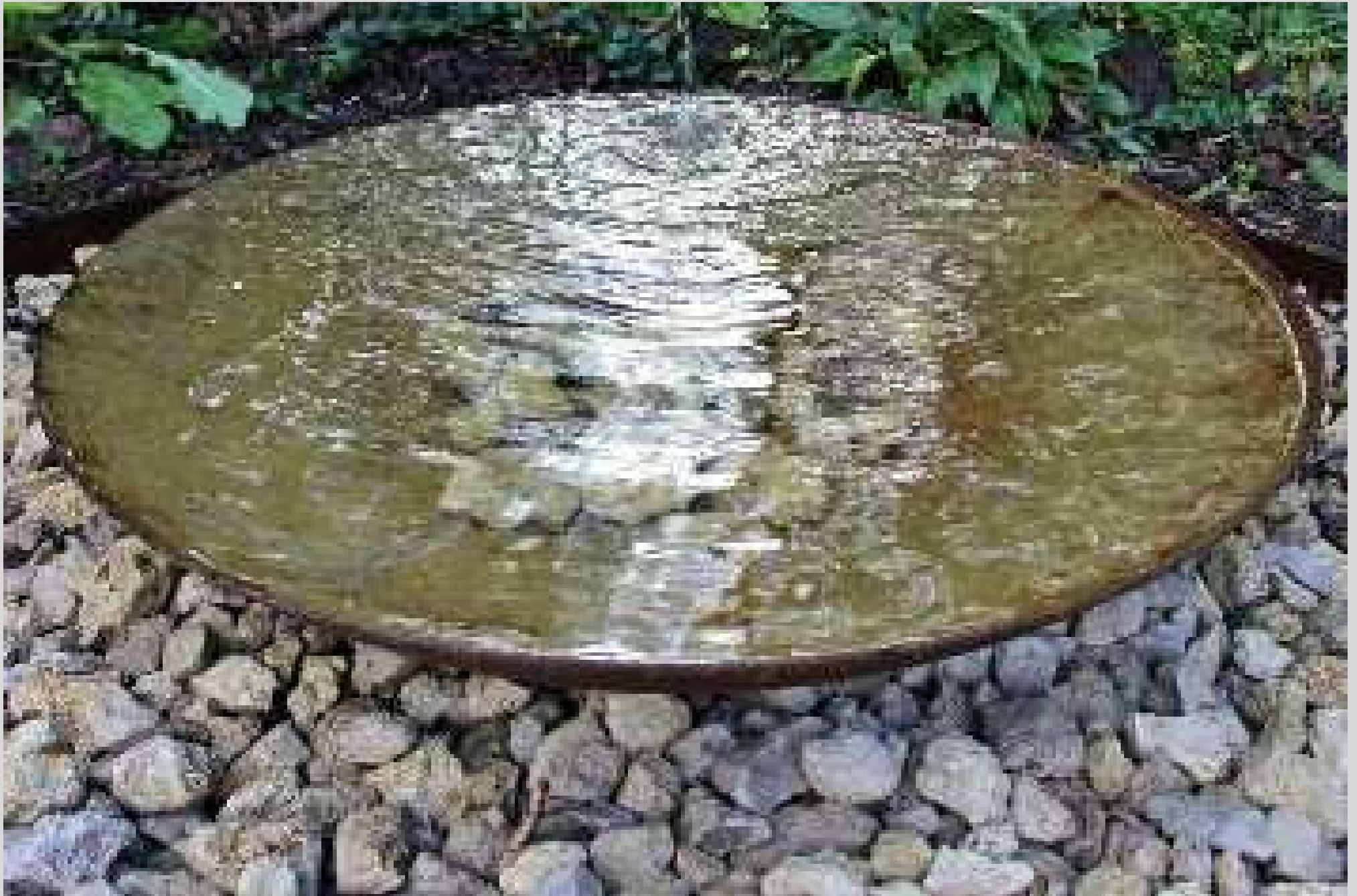
N° 4 – Grâce à un filet d'eau