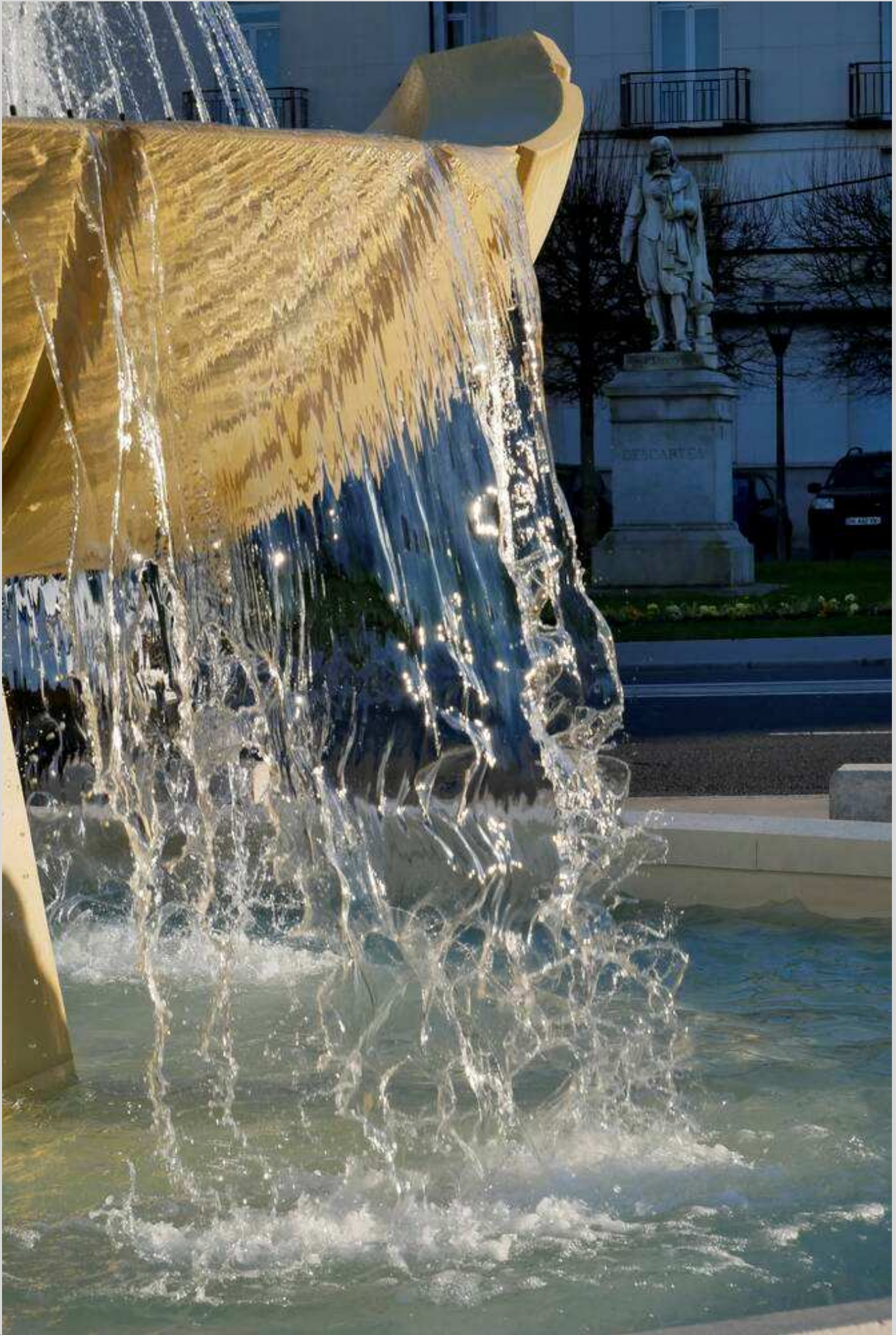
N° 10 – Place Anatole France, Tours