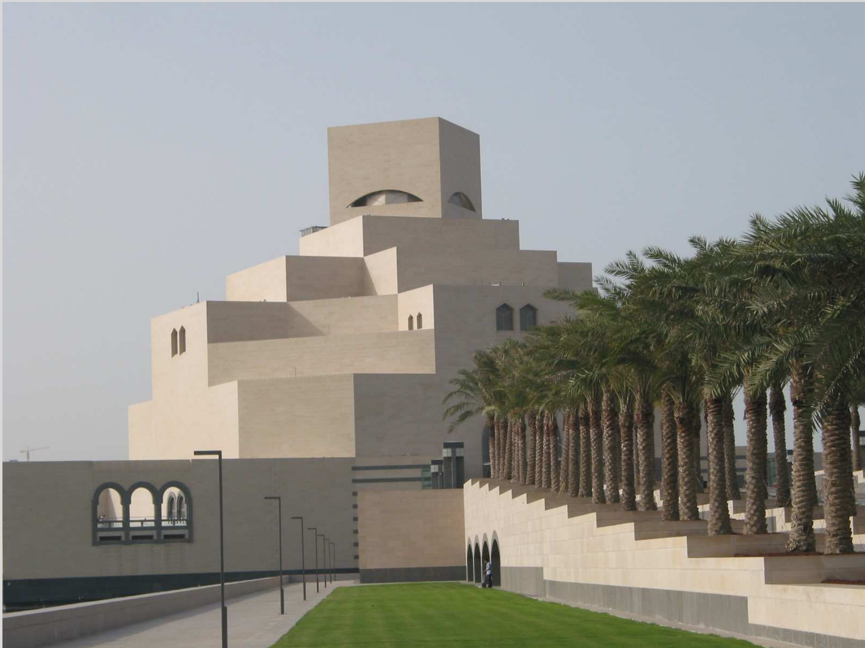
N° 3 – Musée des Arts de l'islam, Doha