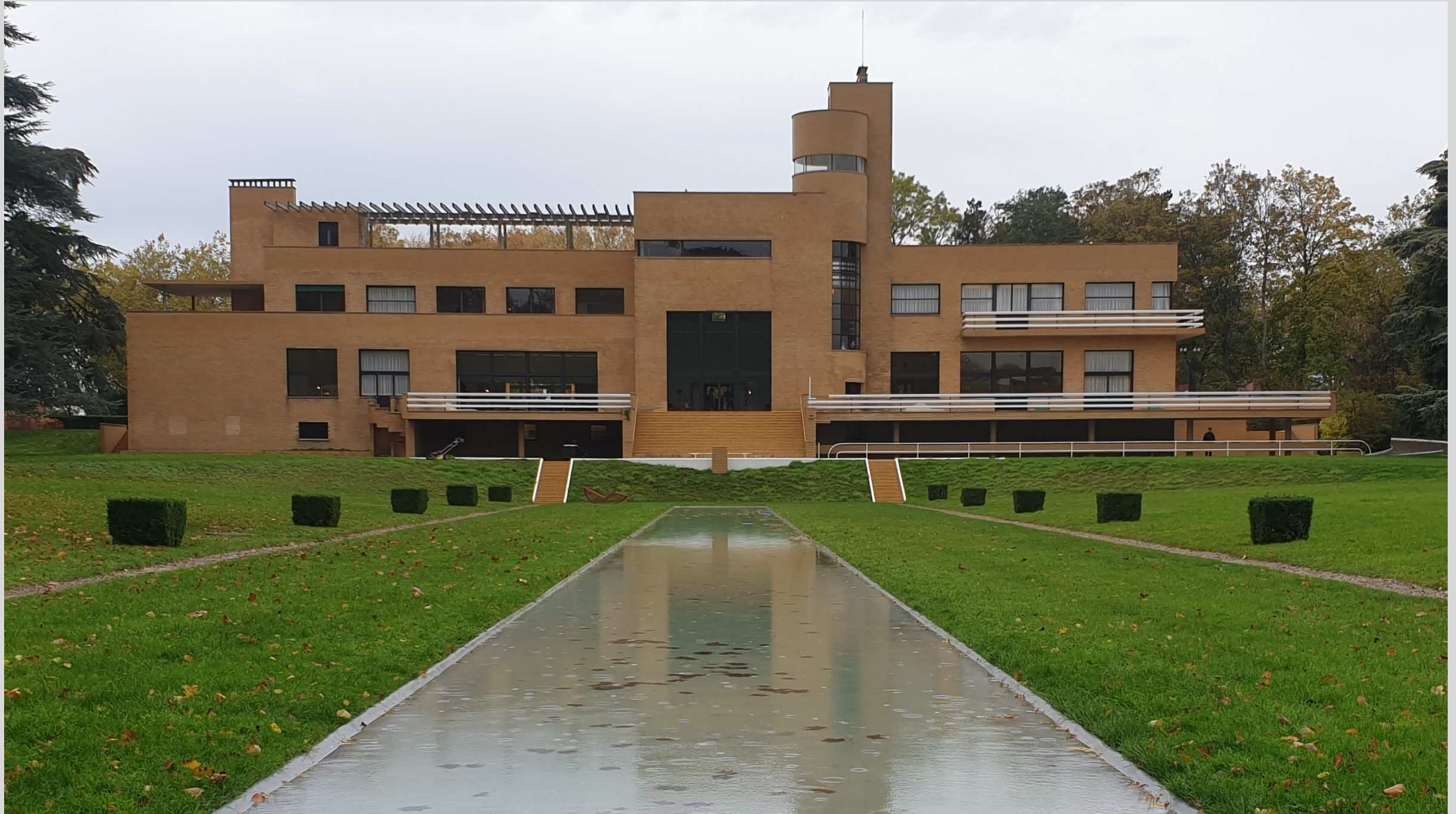
N° 1 – Maison Cavroix par Robert Mallet-Stevens, Lille