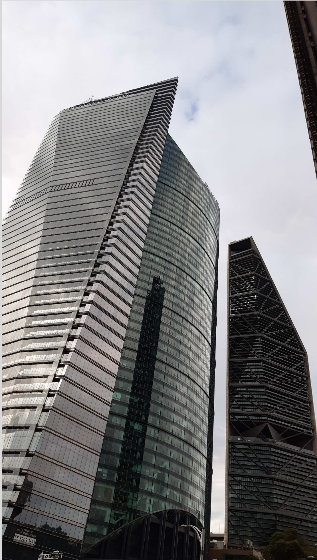
N° 5 – Mexico-Paséo-Reforma