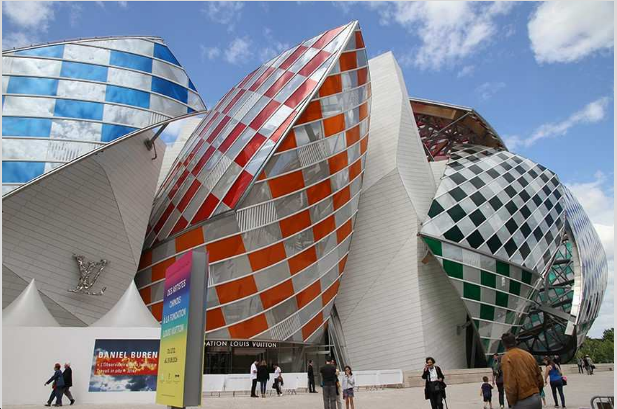
N° 2 – La Fondation Louis Vuitton par Frank Gehry, Paris