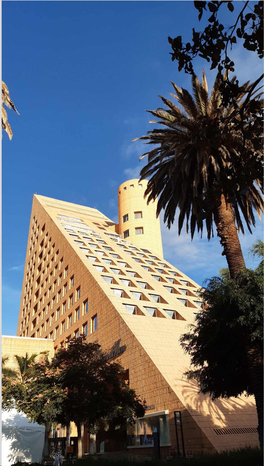
N° 6 – Mexico-Pabellon-Polanco