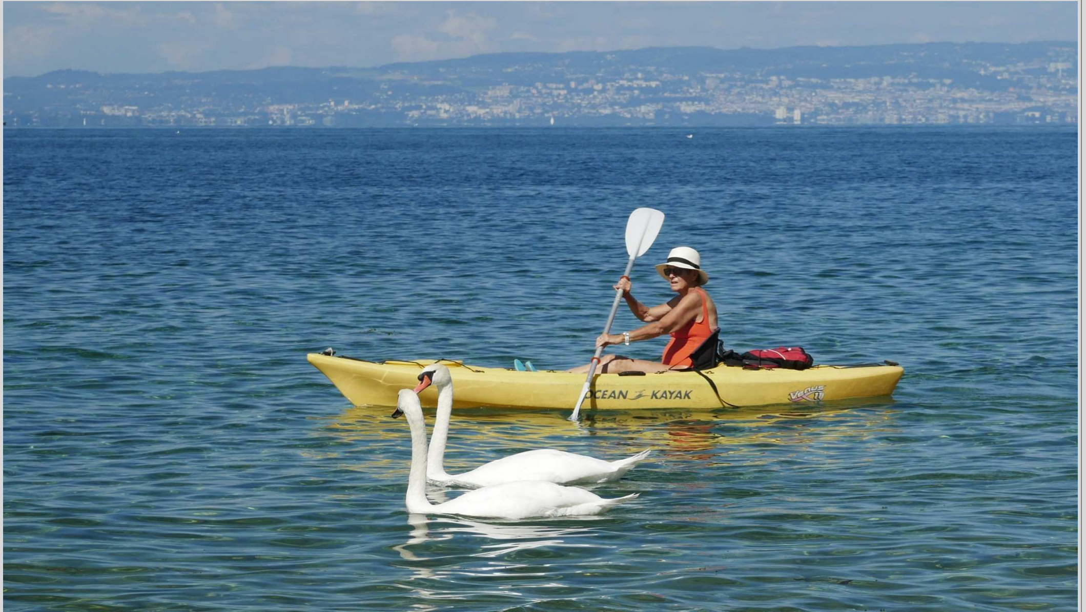
N° 10 – sur le Léman près de Thonon