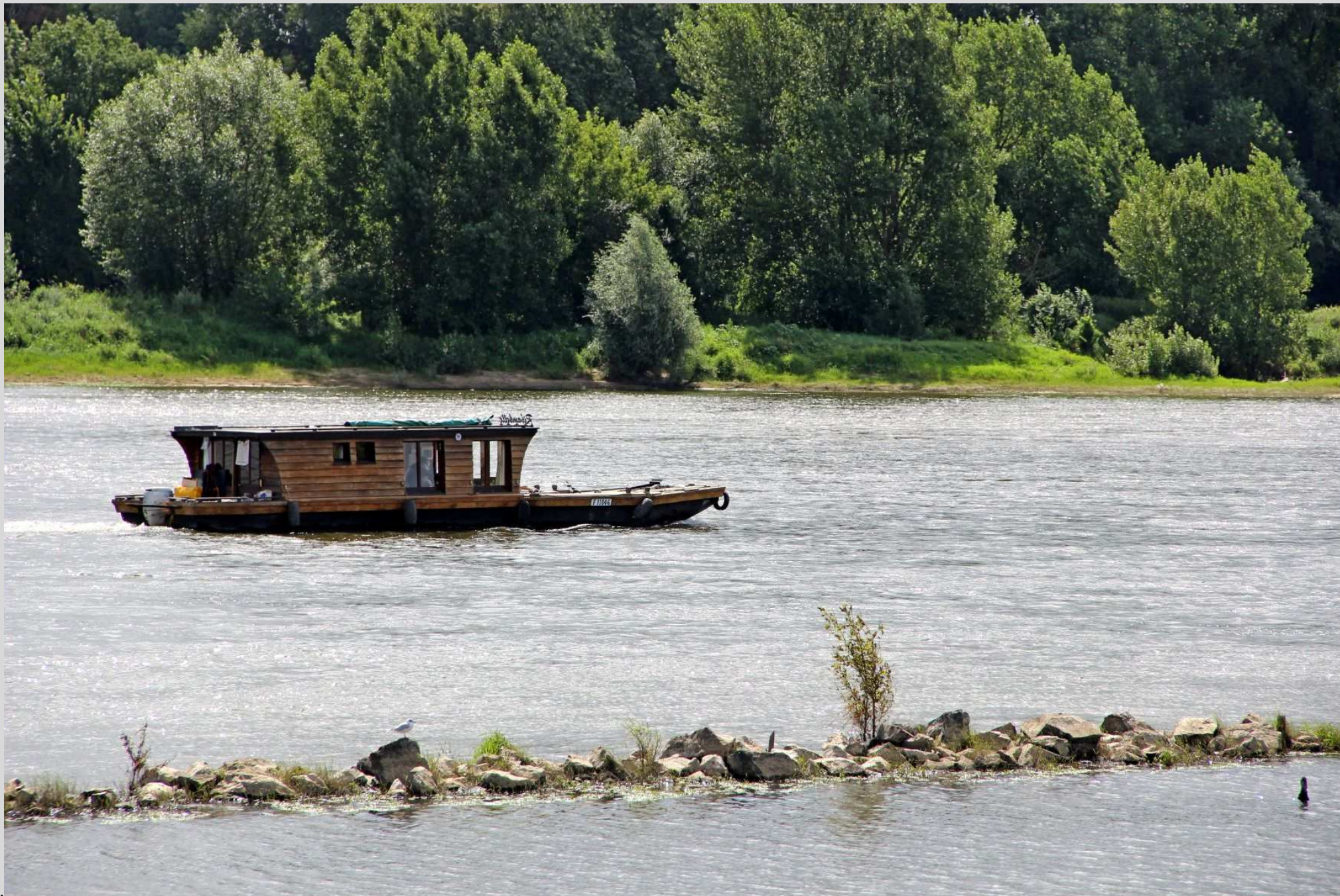
N° 7 – sur La Loire à la confluence avec La Maine