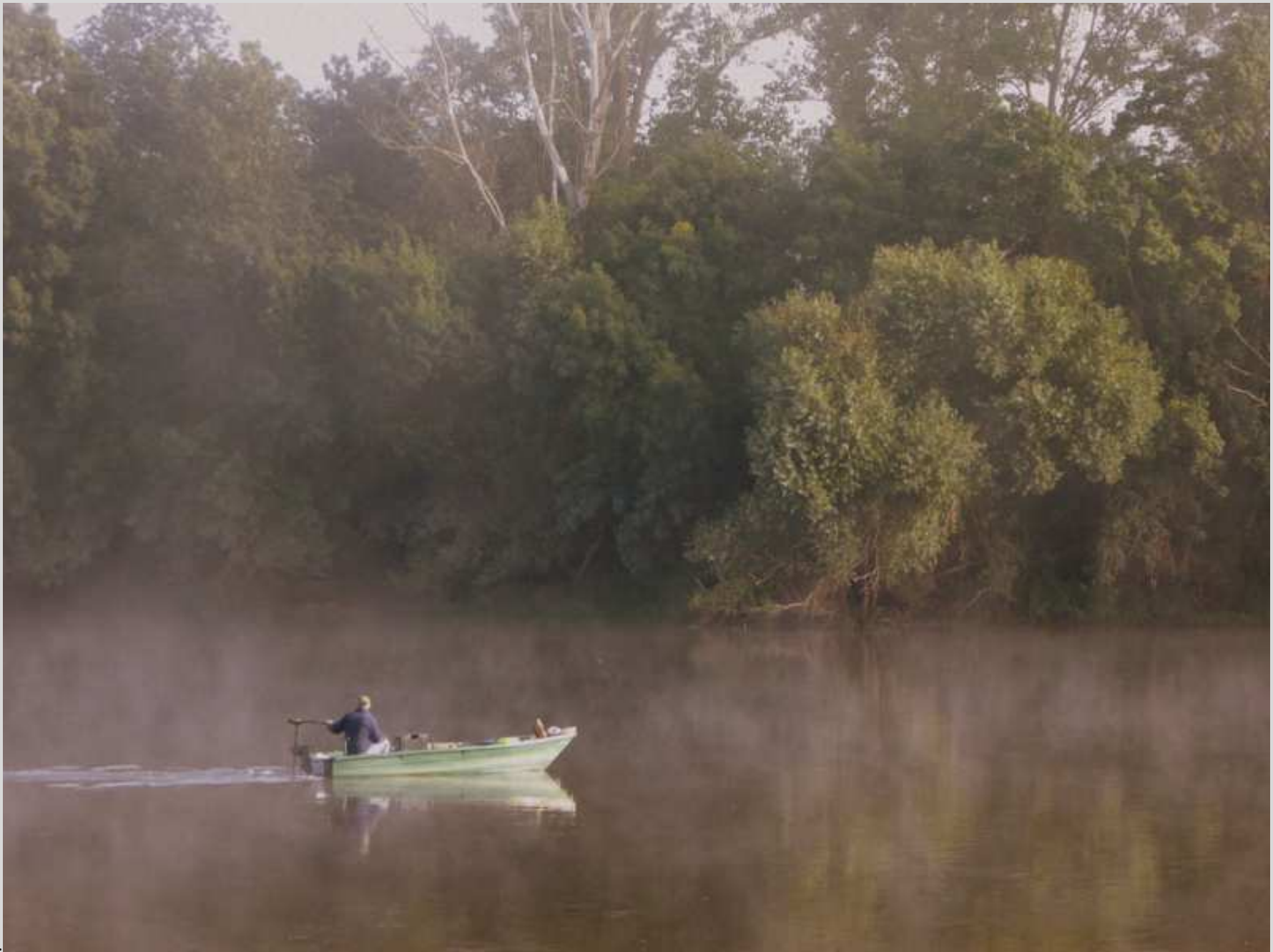
N° 3 – Petit matin d'Automne