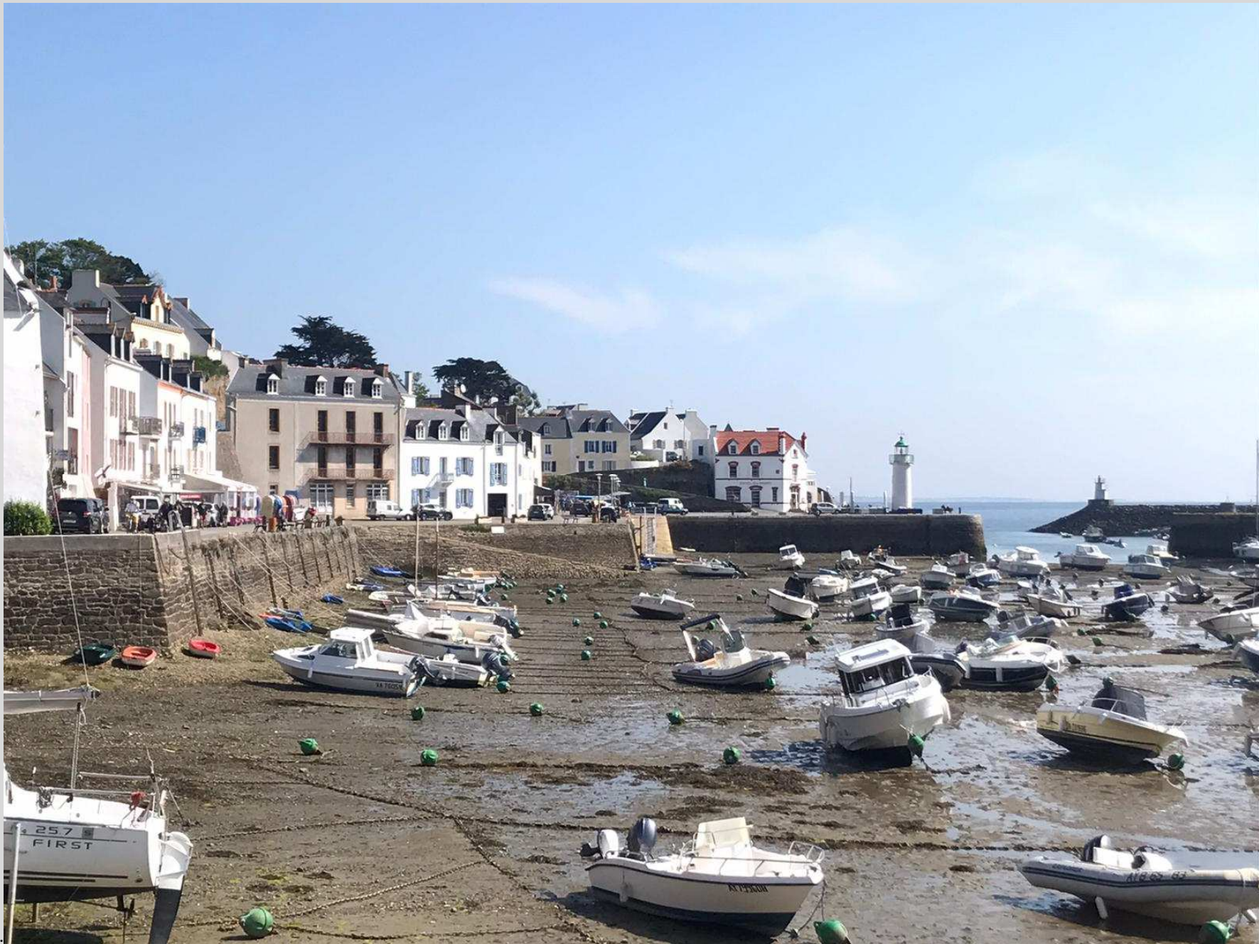
N° 8 – Sauzon Belle-Île en mer