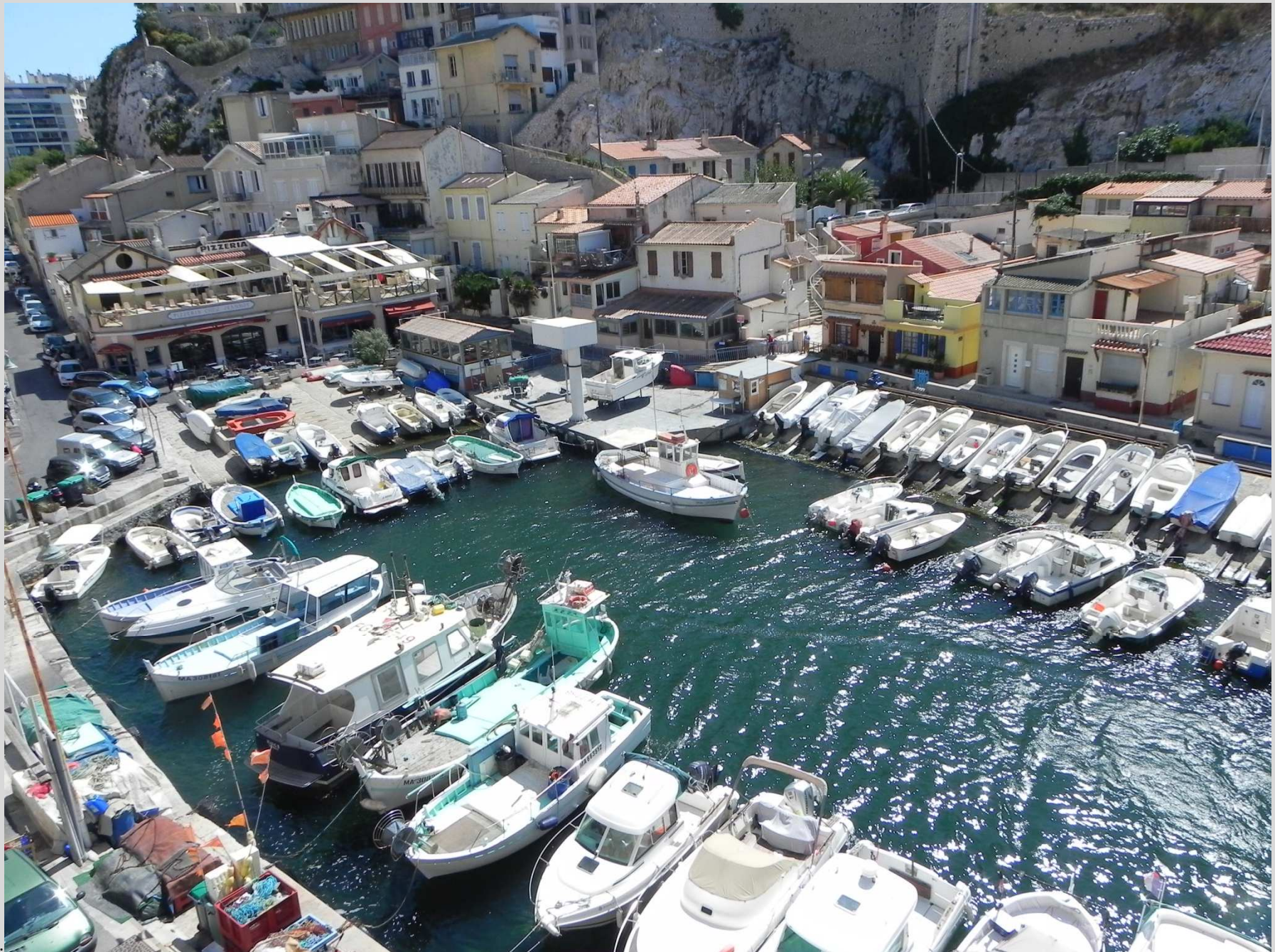
N° 4 – Vallon des Auffres, Marseille