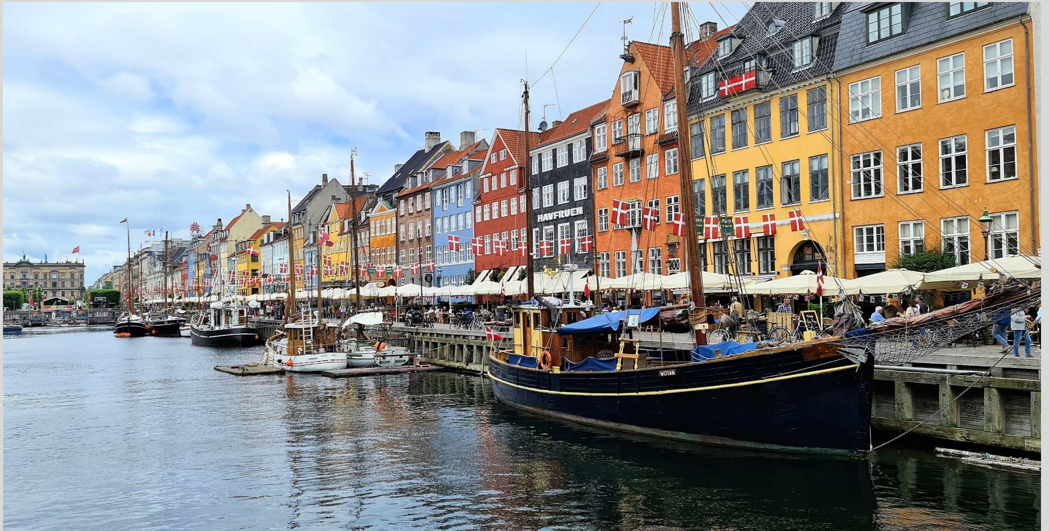
N° 5 – Nyhaven Copenhague