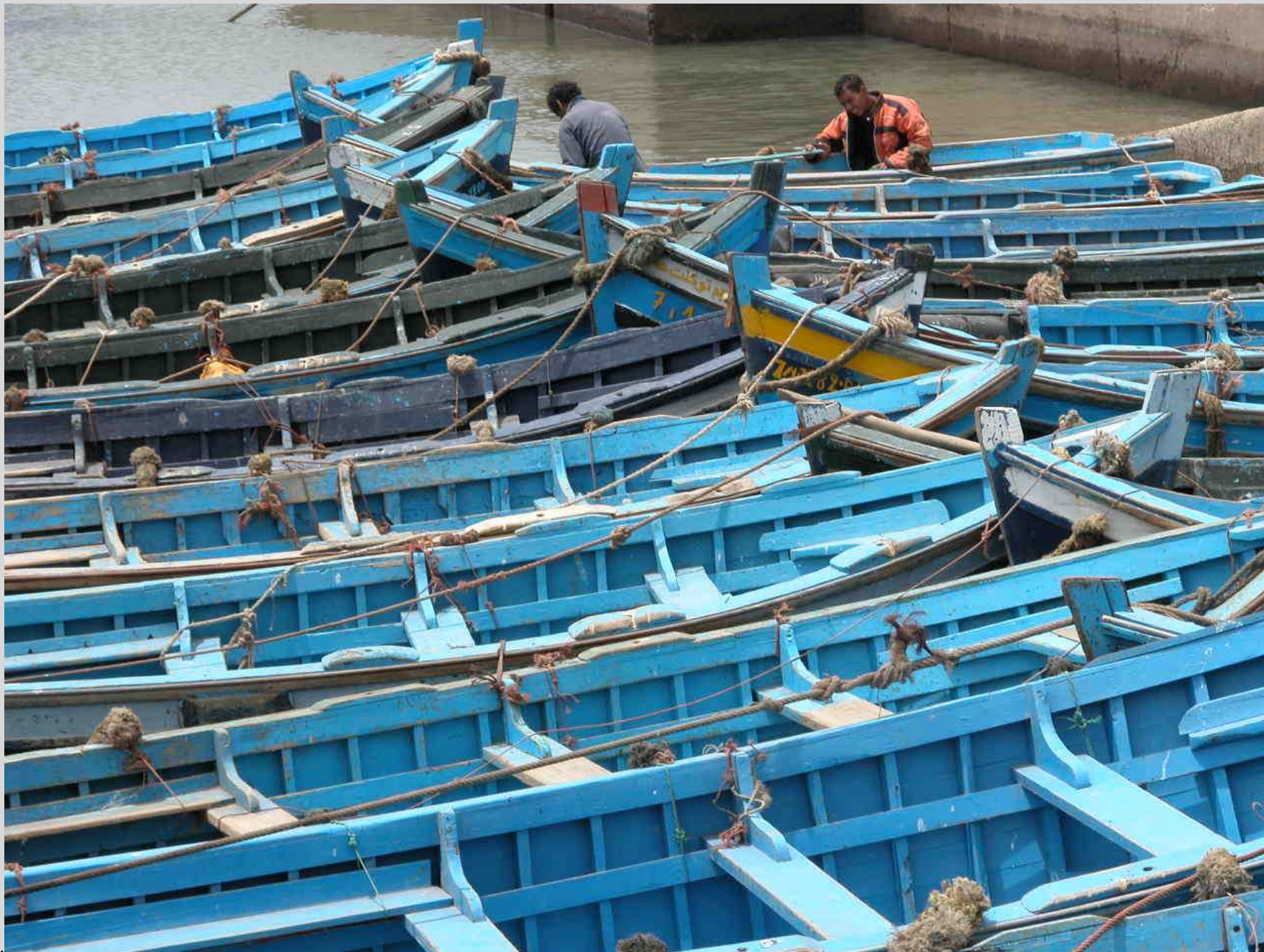
N° 1 – Les bateaux bleus d'Essaouira - Maroc