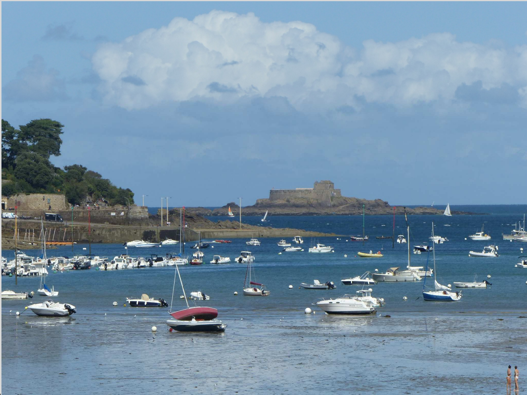
N° 6 – Dinard