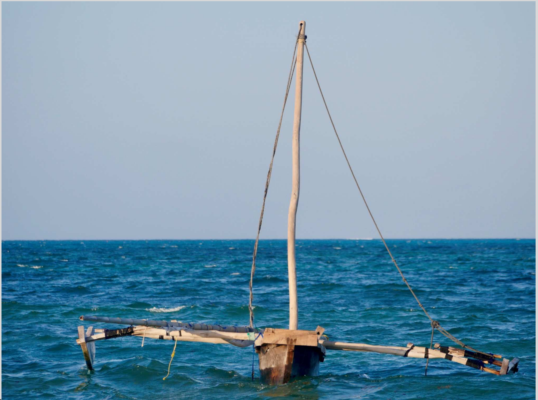
N° 2 – Frêle esquif, Zanzibar