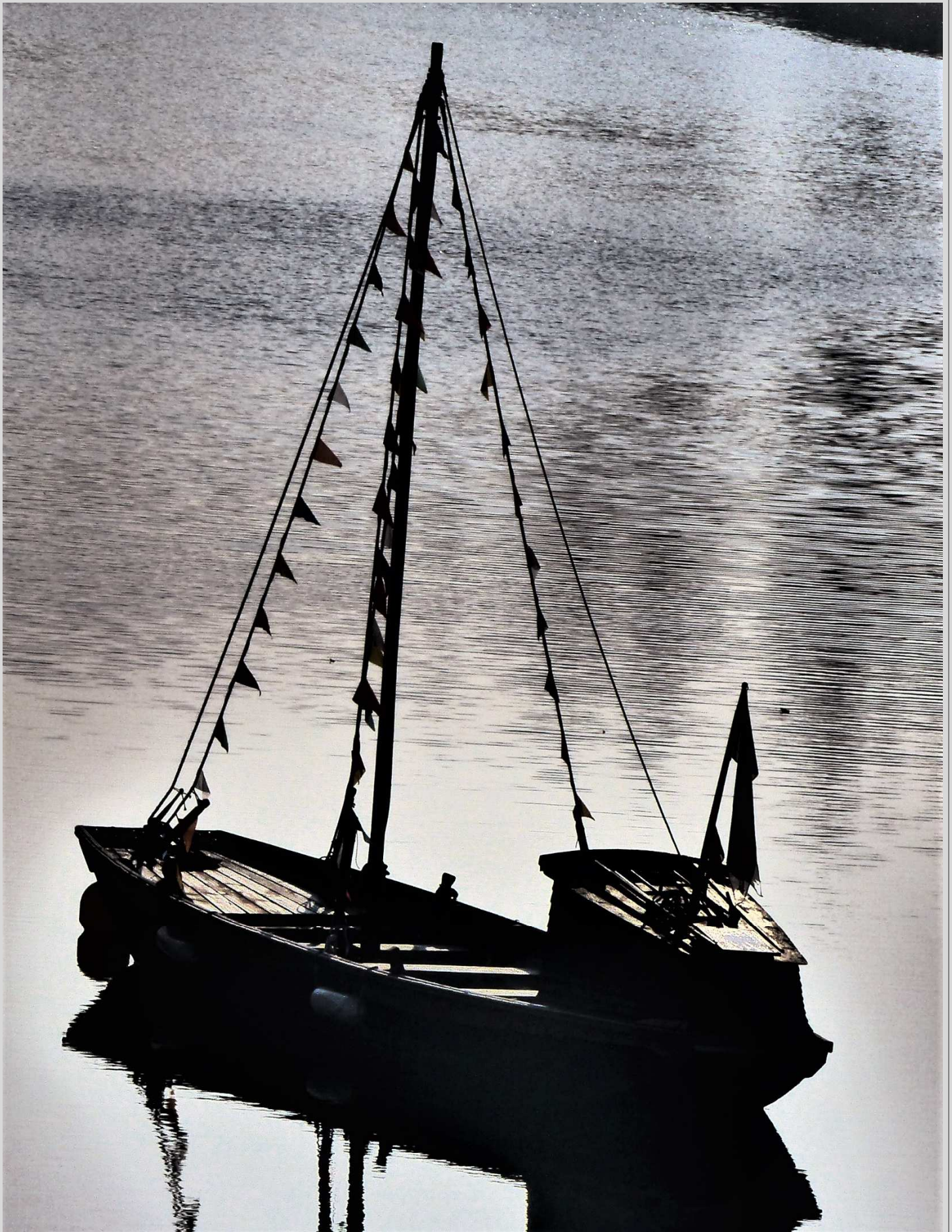
N° 11 – Toue cabanée