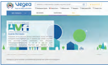
Page d'accueil sur le site Vegea