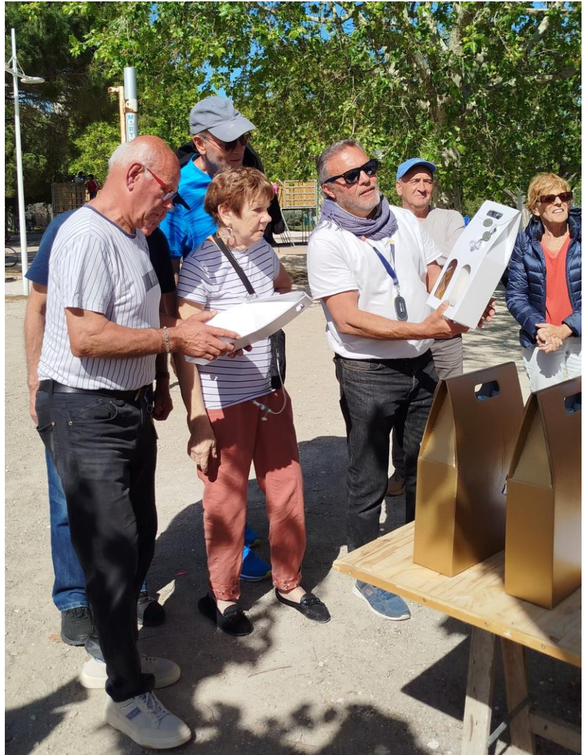
Remise des lots à l'Equipe L, seconde du Tournoi...