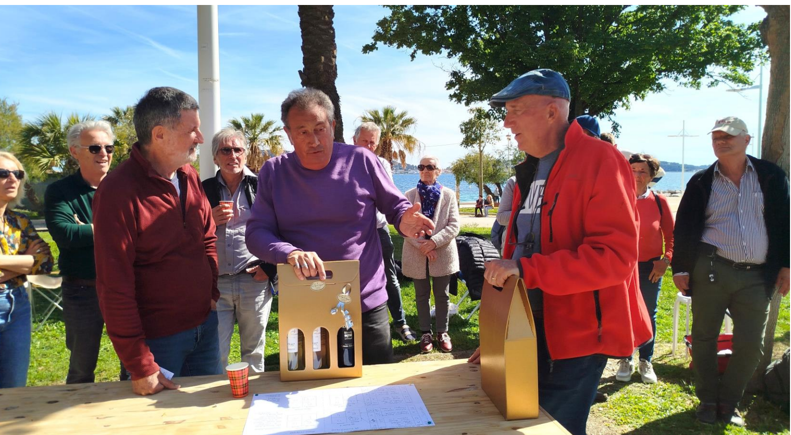
Remise des lots à l'Equipe C, vainqueur du Tournoi...