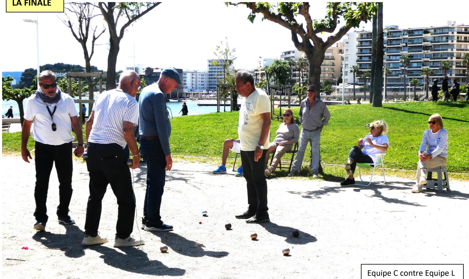
Equipe C contre Equipe L