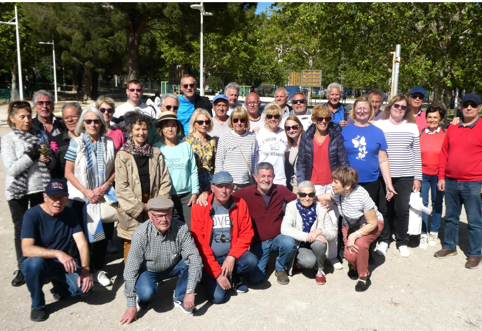
Les participants à la Journée Pétanque (AVF Hyères et AVF Toulon)