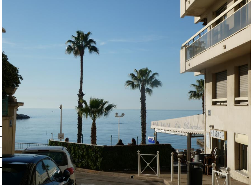
Rue Victor Gensollen vers 9 h

Nom prénom des participants : 10 personnes