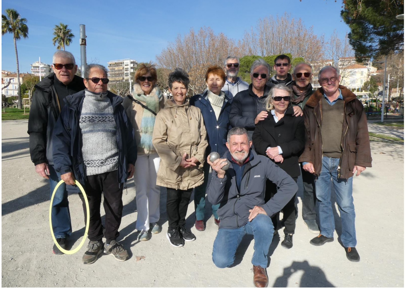
Les participants (Il manque Hélène...)