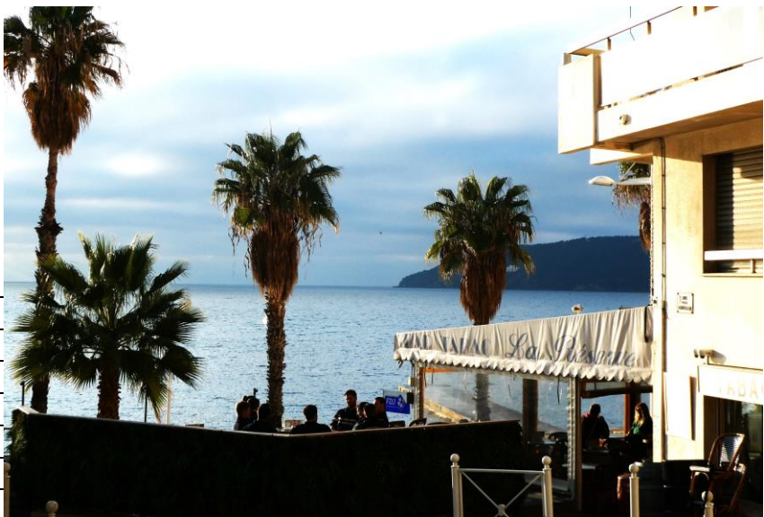
Littoral Frédéric Mistral vers 9 h

Nom prénom des participants : 13 personnes