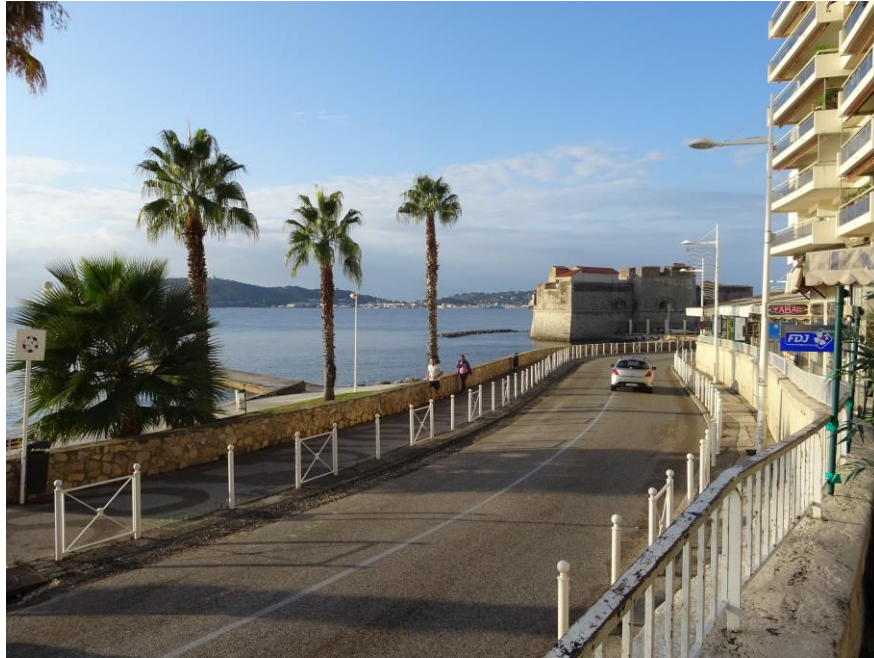
Anse du Lido et rade des Vignettes à 9h

Composition des équipes : quatre équipes (4) à trois joueurs (2 boules chacun) ou deux joueurs (3 boules chacun) composées par tirage au sort.