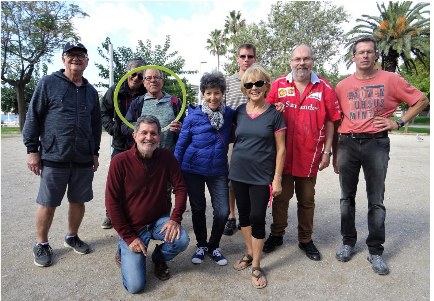
Les participants du jour...