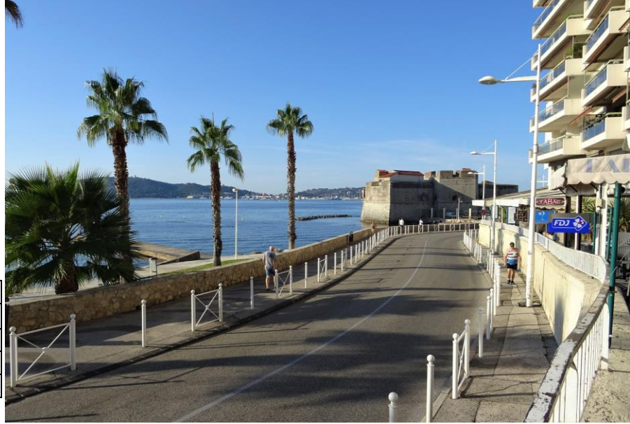
Anse du Lido et rade des Vignettes le 12 septembre à 9h

Composition des équipes : quatre équipes (4) à trois joueurs (2 boules chacun) ou deux joueurs (3 boules chacun) composées par tirage au sort.