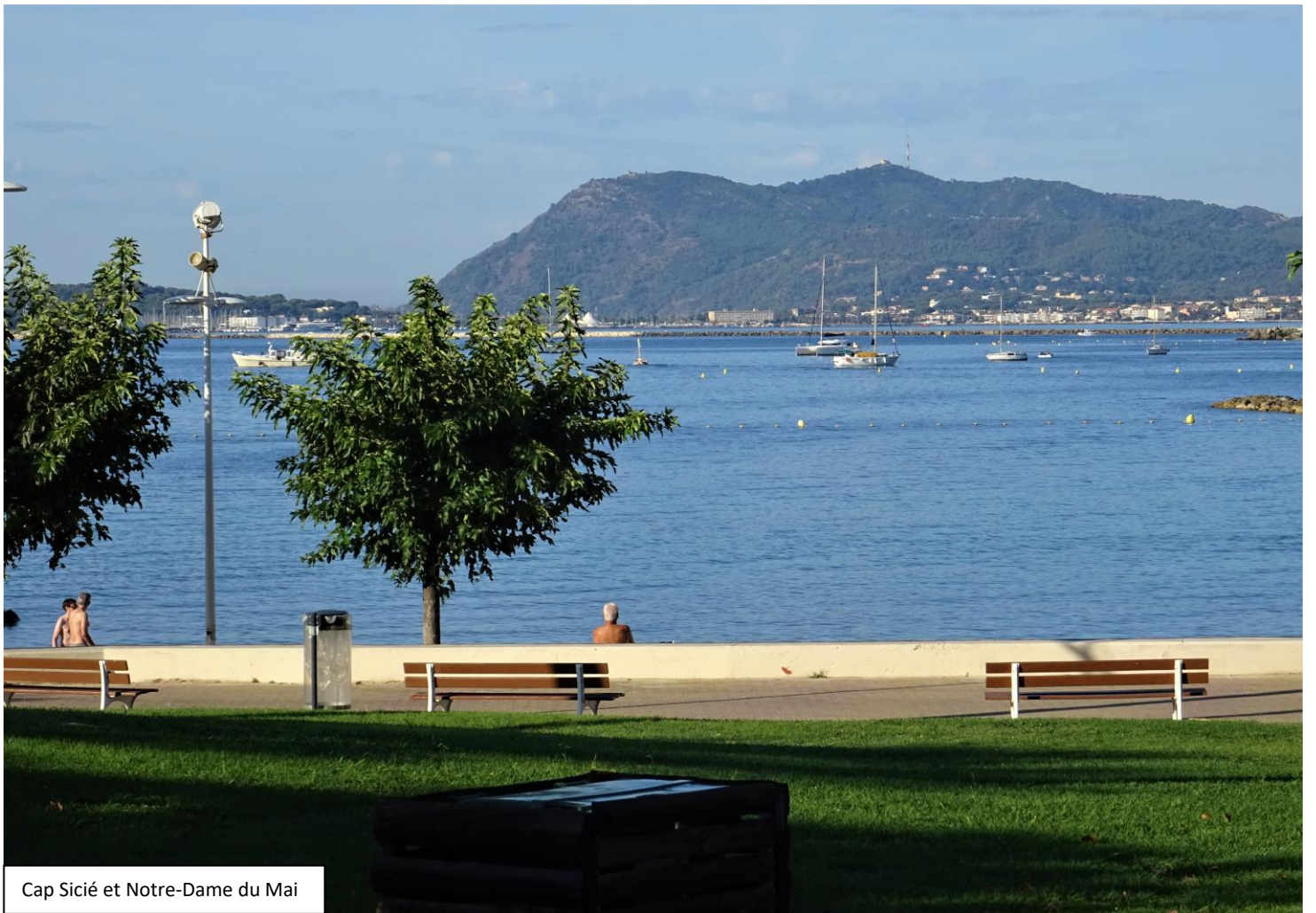
Cap Sicié et Notre-Dame du Mai