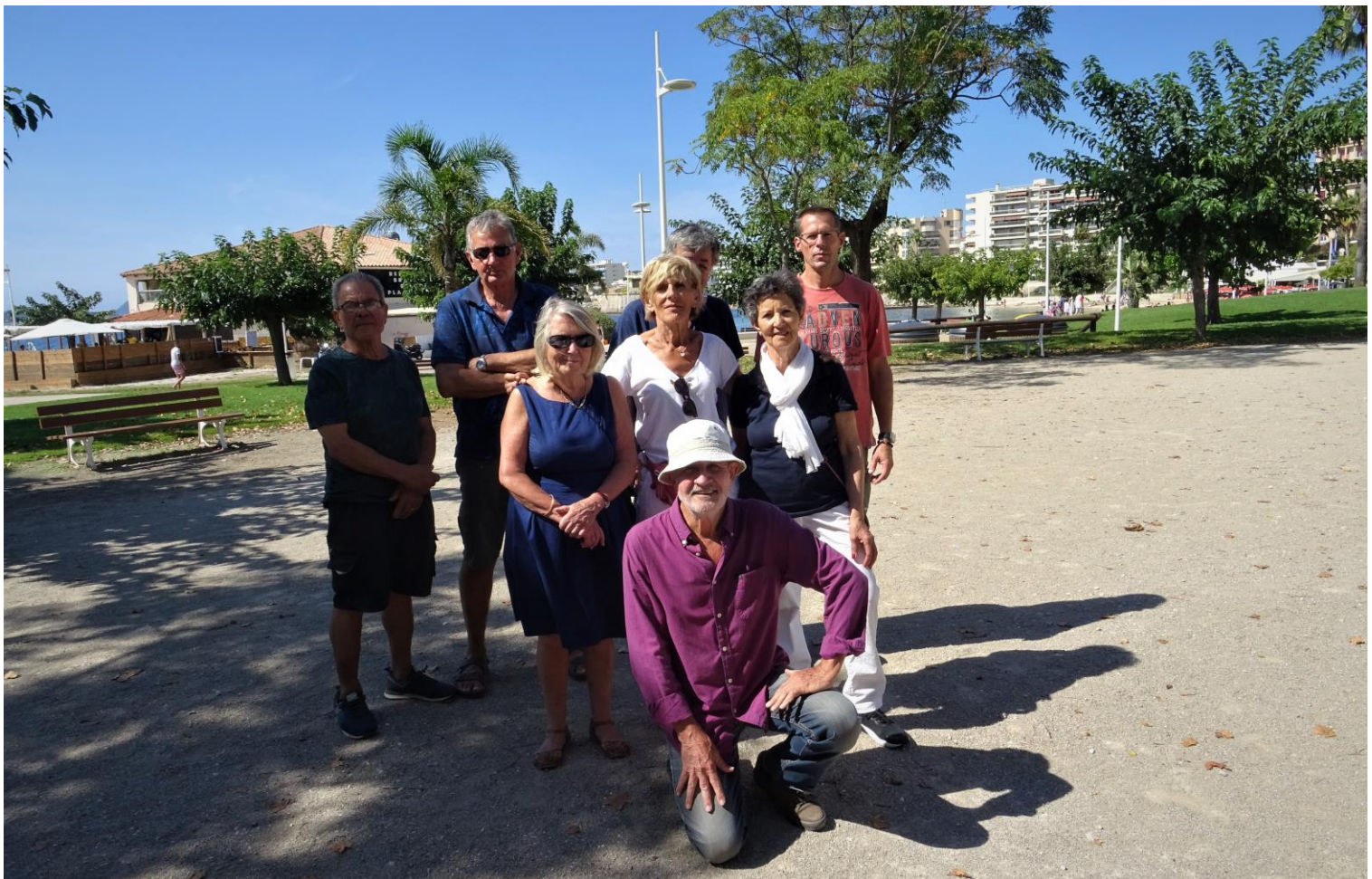
Les participants du jour...