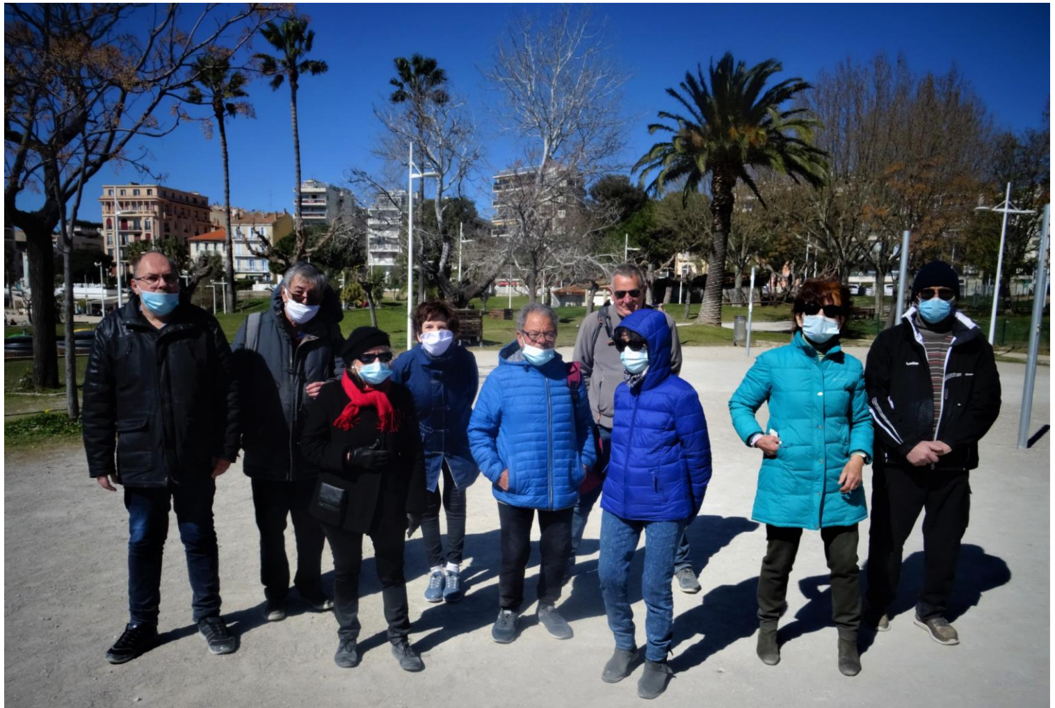
Les participants (NB : l'animateur prend la photo !)