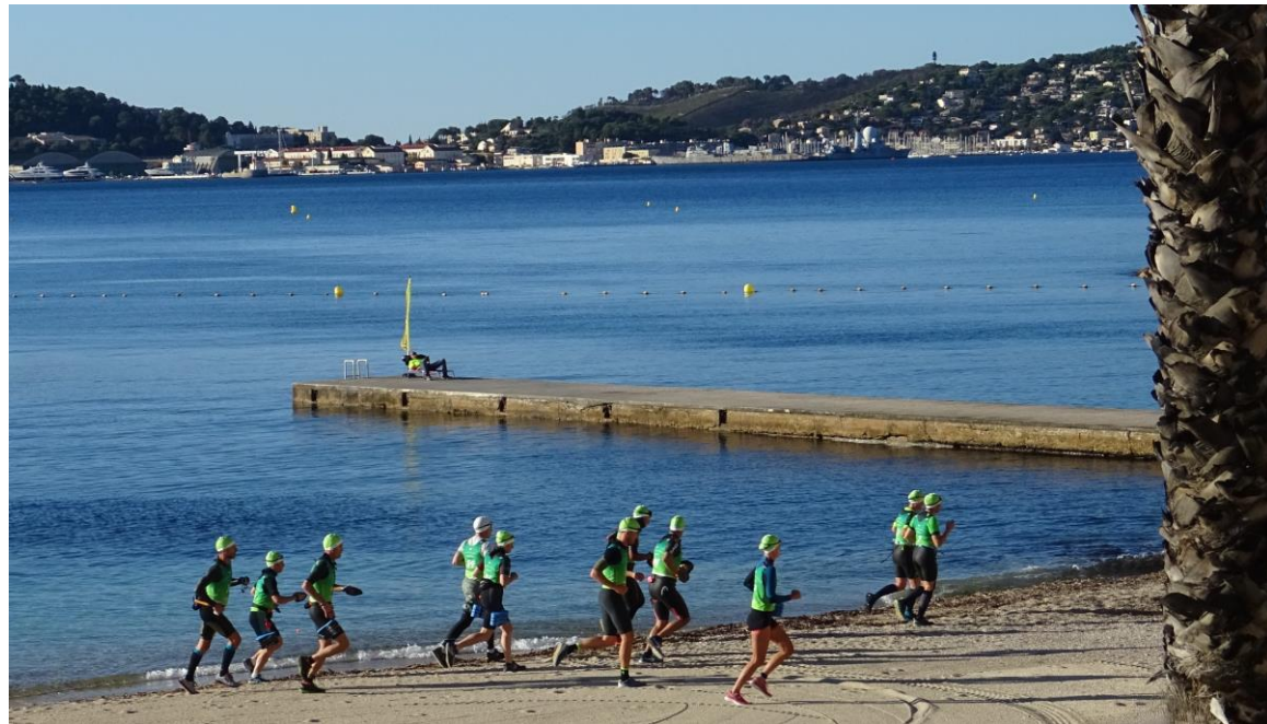
Course à pied...