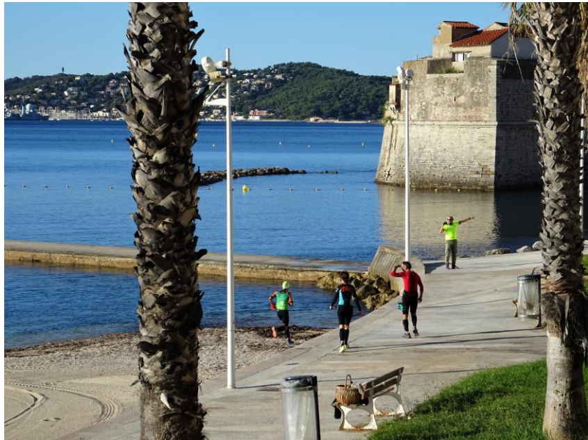
Anse du Lido à 9 h : épreuve en cours de « Swimrun »

Date : dimanche 13 septembre 2020 Lieu de la rencontre : Toulon Mourillon Horaire rendez-vous : 9h15 Fin activité : 12h Animatrice : Lise DESGRIPPES Nom prénom des participants : 9 personnes + 2