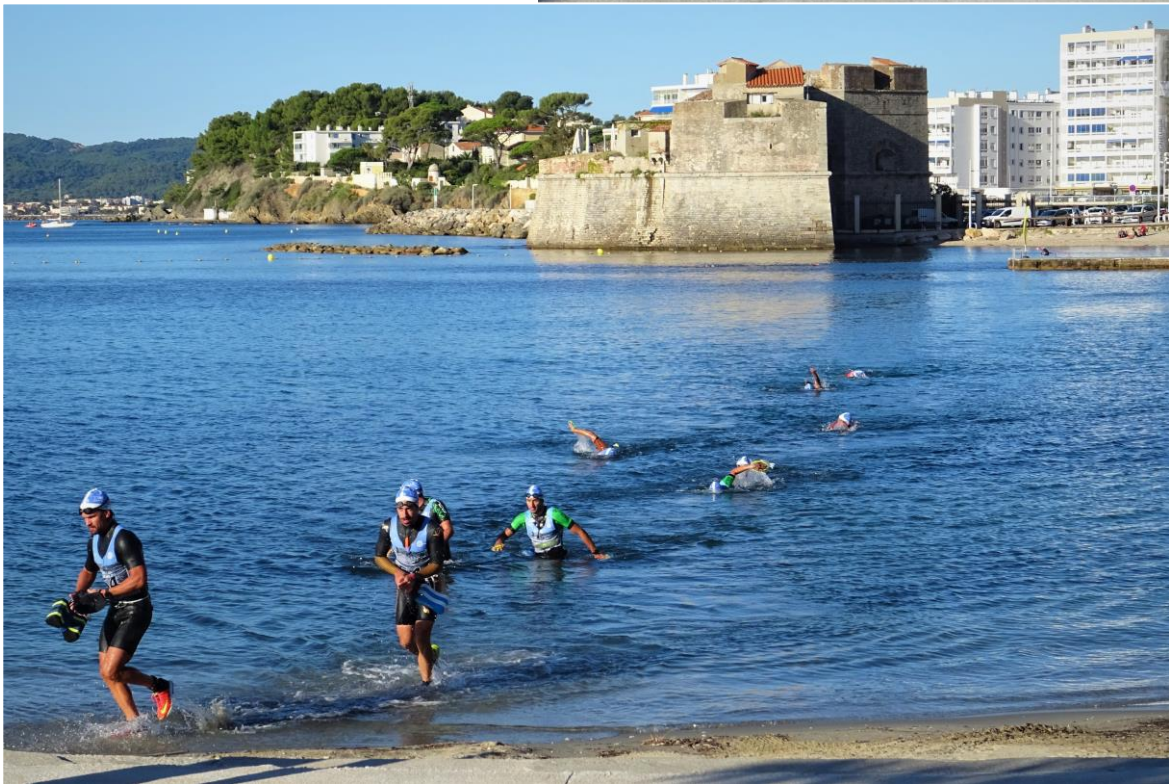
Les sportifs du Swimrun courent et nagent tout autour de nous...