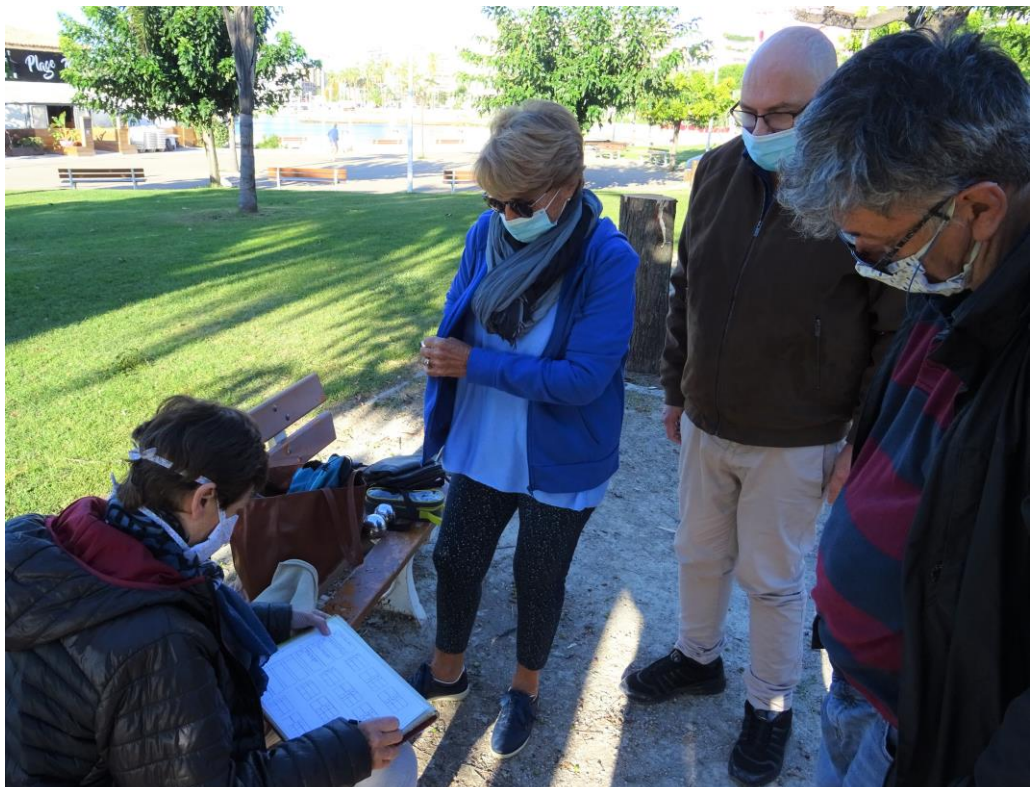
Tandis que l'animatrice de l'AVF Toulon inscrit ses participants à la Pétanque et tire au sort les équipes...