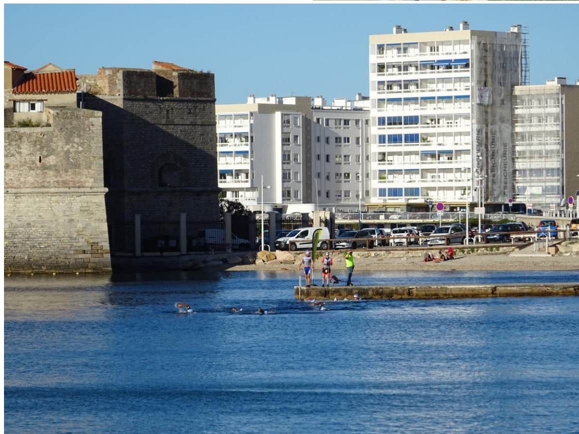
... et natation.