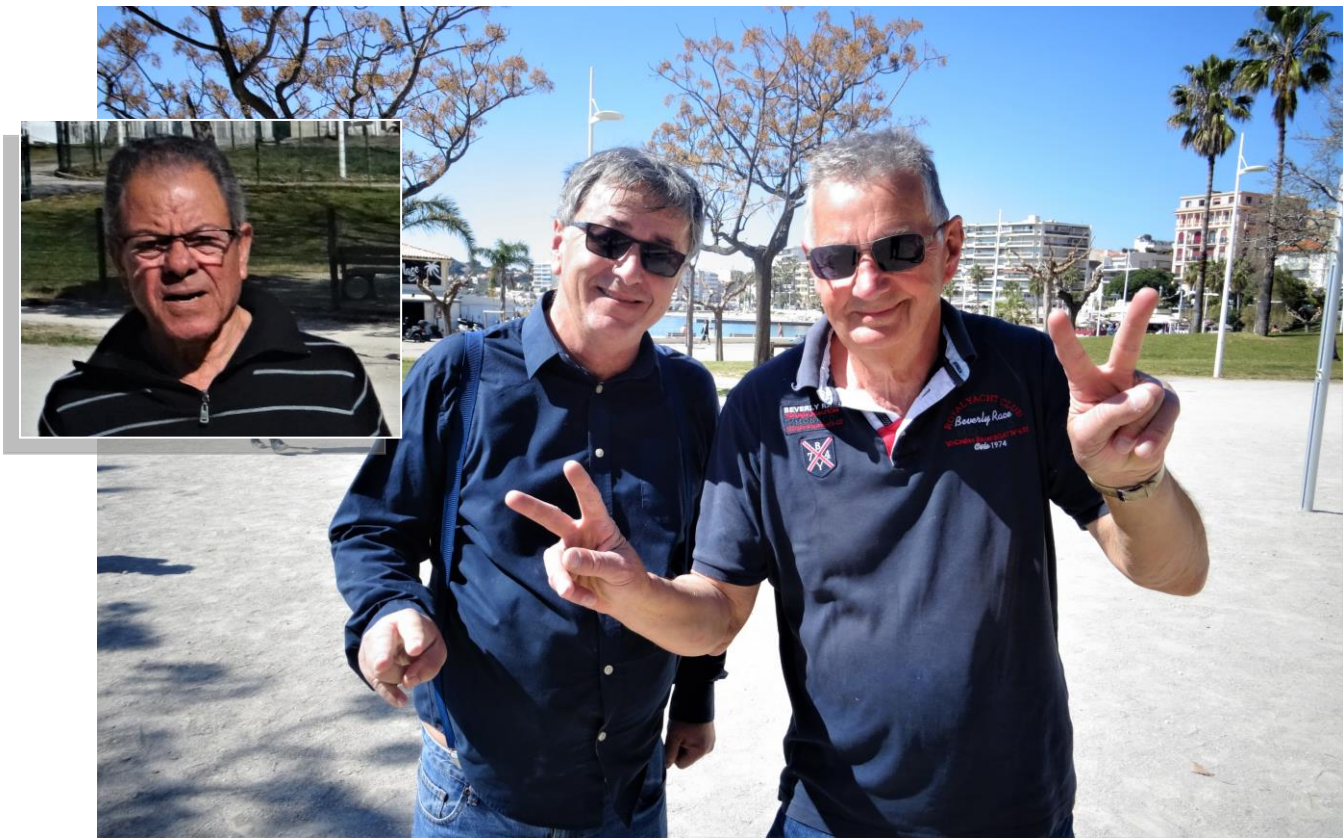
Les vainqueurs : Equipe C