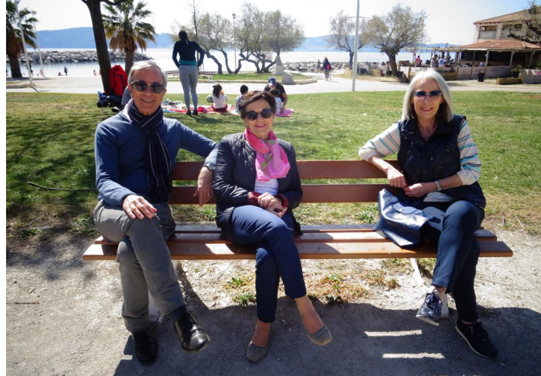
De sympathiques supporters...