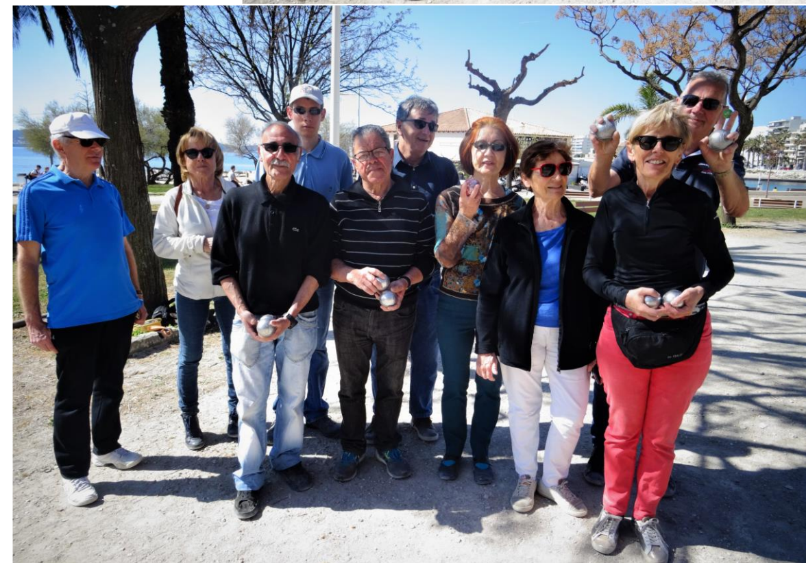
Le groupe de joueurs...