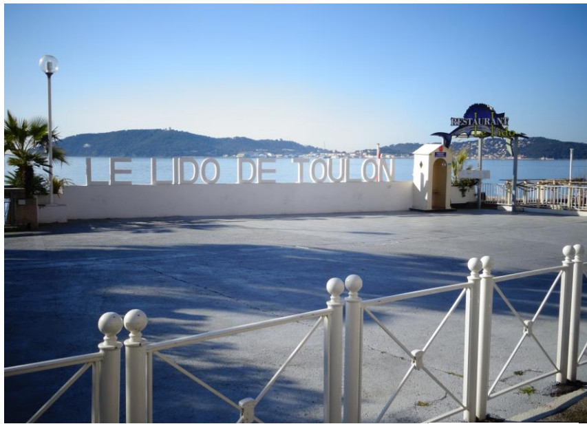
Anse du Lido à 9 h

Nom prénom des participants : 12 personnes