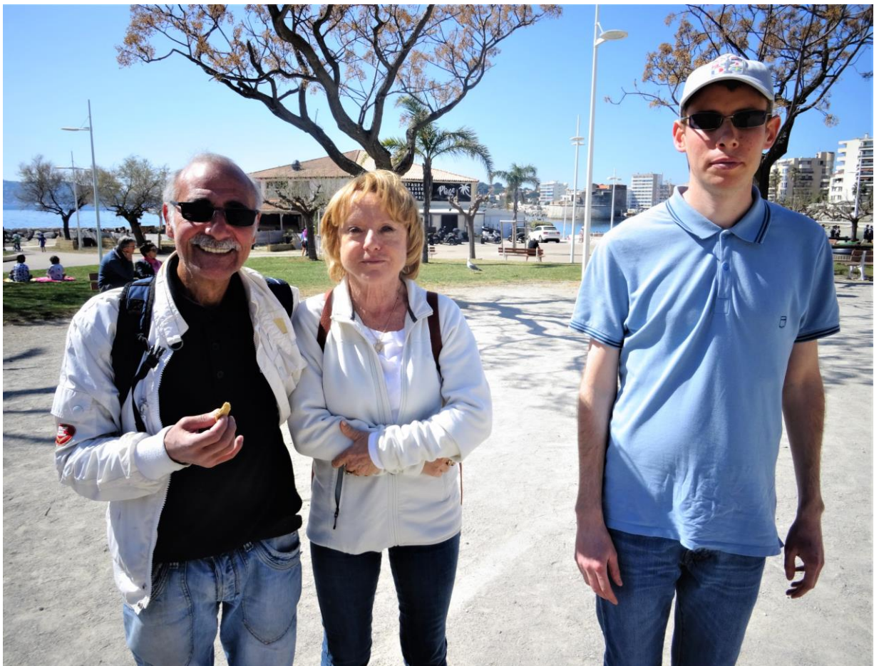
Les seconds : Equipe A