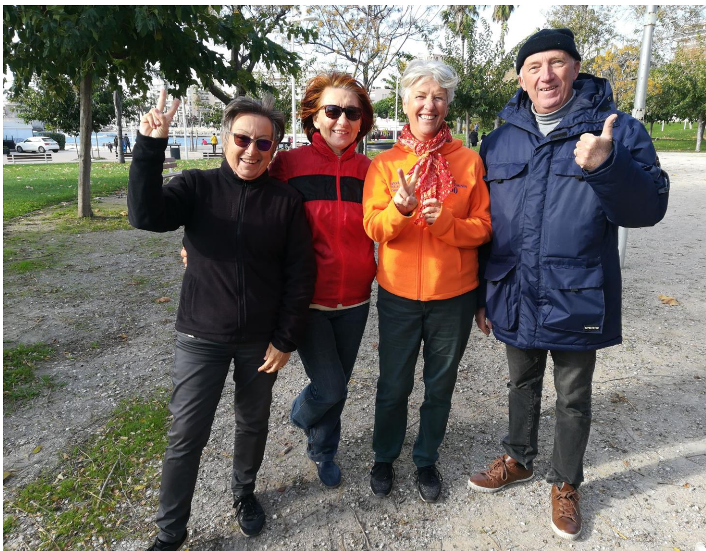
Les vainqueurs : Equipe C