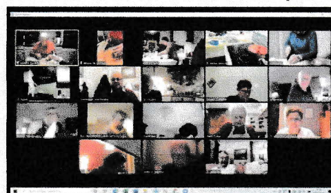
Les Jeudis-webs à l'AVF Dijon : cuisine, bien-être, visites virtuelles...