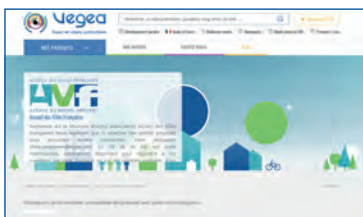
Page d'accueil sur le site Vegea