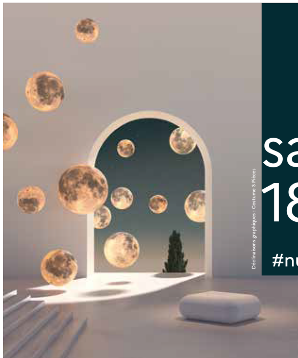
Déclinaison graphique - Costume 3 pièces