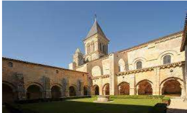
visite de l'abbaye de Nieul-sur-l' Autise

visite de la maison de la meunerie, visite guidée par le meunier avec fabrication de farine