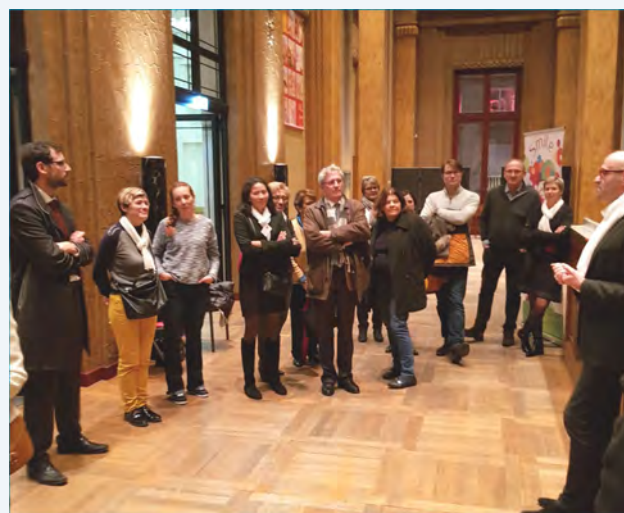
Reims - Visite de l'Opéra

Le Conseil d'Administration d'AVF Reims, grâce à cette initiative, offrira un service adapté et attractif à ces jeunes Nouveaux Arrivants et ainsi faciliter leur intégration.