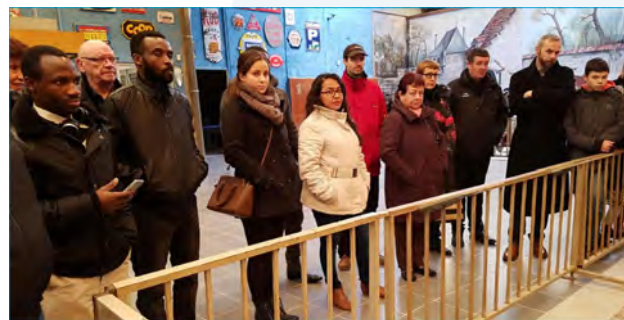
Reims - Visite du Musée de l'Automobile

Les membres d'AVF Reims Dynamique sont d'ores et déjà invités à un cycle de conférences « On refait l'éco » données en soirée et animées par un économiste de renom. Le cycle a débuté fin février et se poursuivra chaque fin de mois jusqu'aux vacances d'été.