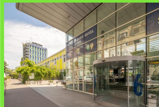
Assises des AVF d'IdF le 21 novembre Au CIS Paris Ravel