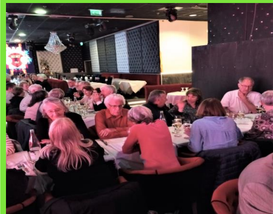
Fête des bénévoles