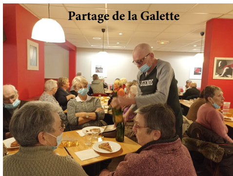
Partage de la Galette