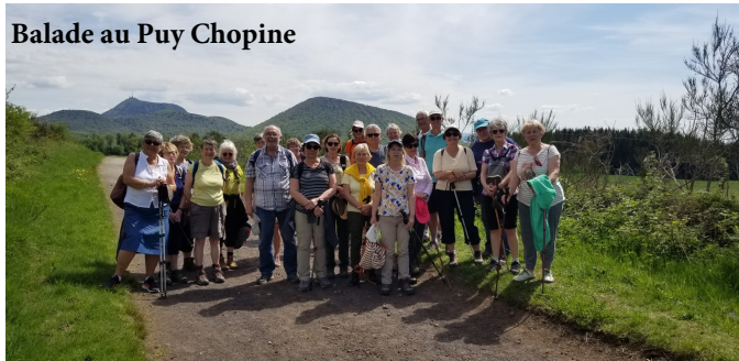
Balade au Puy Chopine