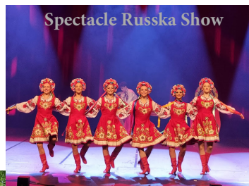
Spectacle Russka Show