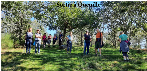
Sortie à Queuille