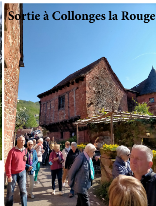
Sortie à Collonges la Rouge