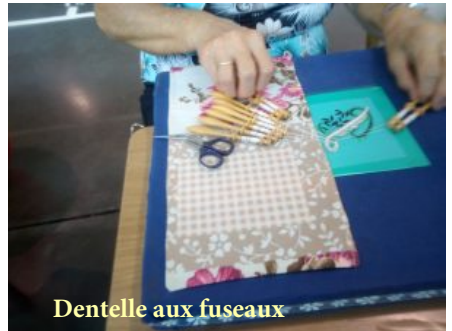
Dentelle aux fuseaux