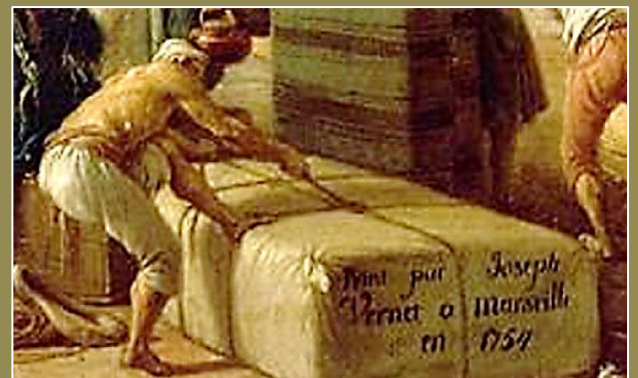
Des exportations vers le Levant ...