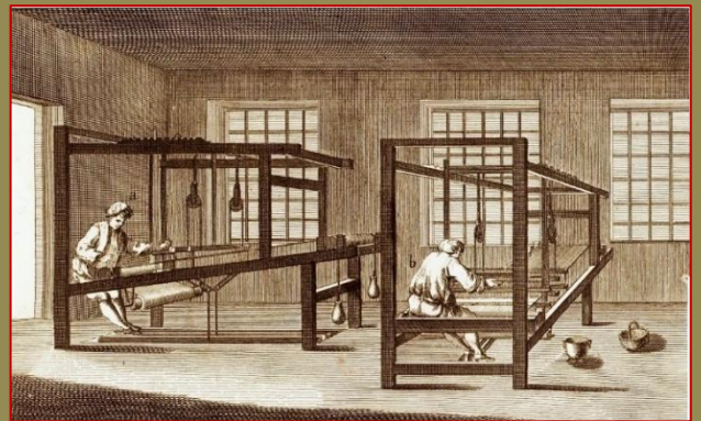
Des métiers à faire des bas

Des « tanyrias » et des « facharias » dans la « carreyra de l'Aygue » autrement dit la rue du Temple à Revel