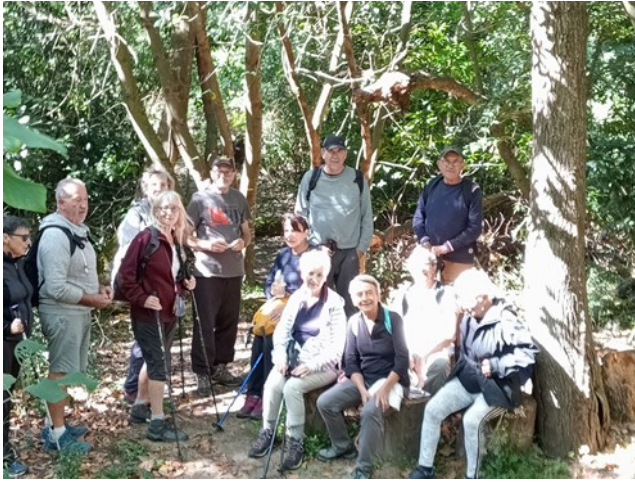
Le groupe du vendredi 22 septembre