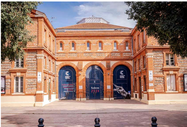
18/04 : Virtuose Halle aux grains