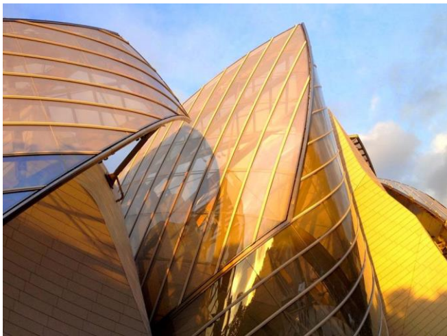
10/04 : Jean Nouvel et ses Musées