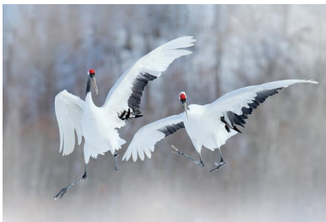
11/05 : Sex-appeal, la scandaleuse vie de la nature