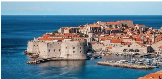
12/04 : Autour de Dubrovnik