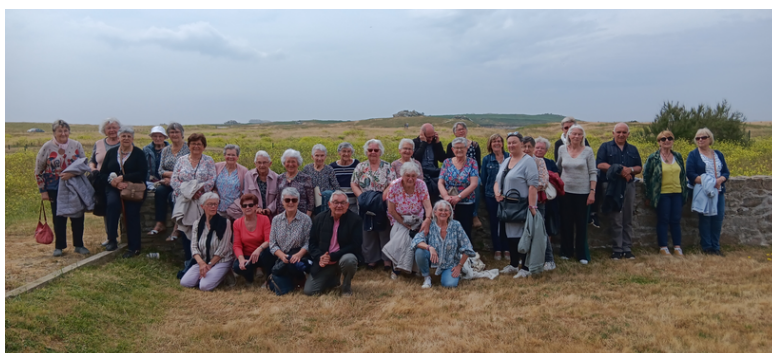
Sortie de fin d'année à Porsporder

Sortie des bénévoles - Visite de la chocolaterie de Saint Thonan avec une autre asso à Riec sur Belon, Pont - Aven et sur l'Aven