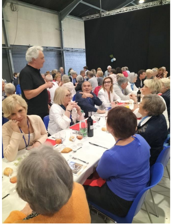
Une danse endiablée entre la "poire et le fromage"