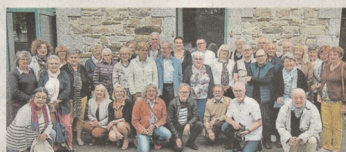
Comme de nombreuses associations, l'association Accueil des villes françaises recherche des bénévoles pour aider à son développement.