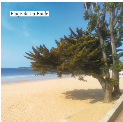
Plage de La Baule

Nicolas LANGEVIN nicolas.langevin@allianz.fr Tél. : 07 61 74 74 18