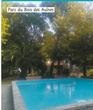
Parc du Bois des Aulnes