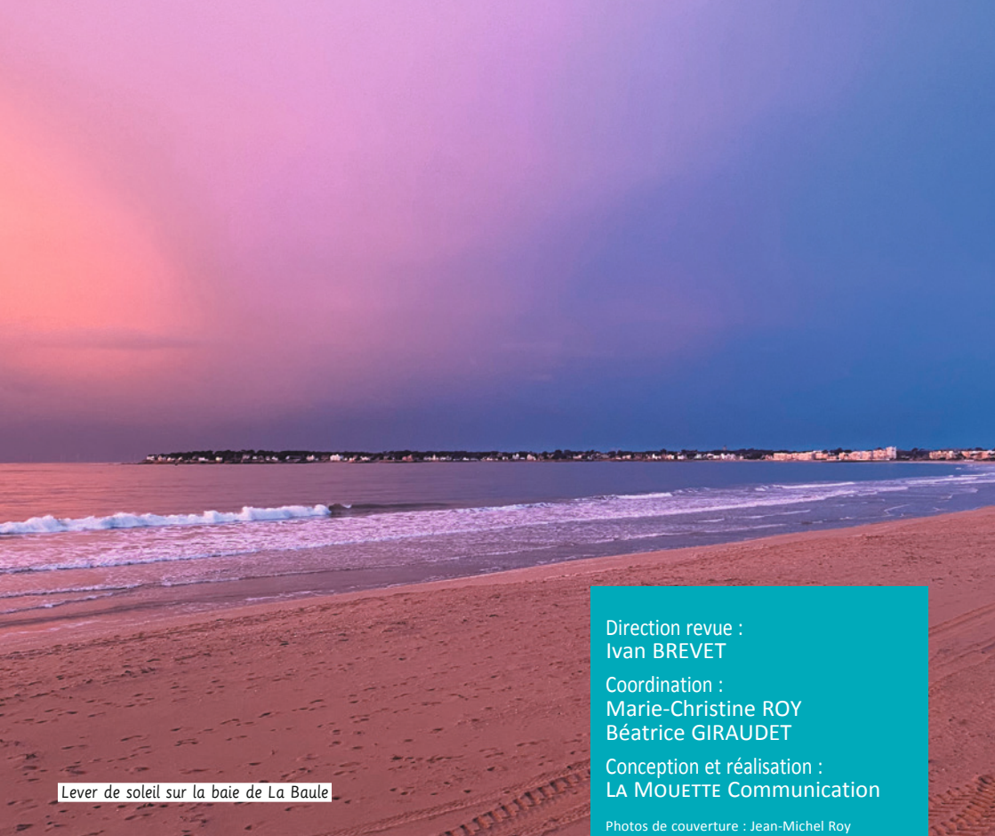
Lever de soleil sur la baie de La Baule

Direction revue : Ivan BREVET Coordination : Marie-Christine ROY Béatrice GIRAUDET Conception et réalisation : LA MOUETTE Communication