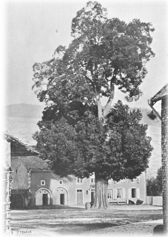
Vers 1860 déjà un bel adulte au long passé