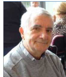
Claude Guillemet Informatique