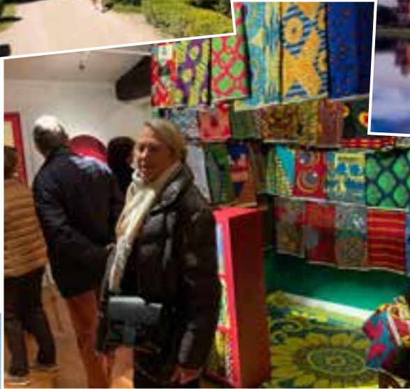
▶ Expo WAX Bourgoin-Jallieu