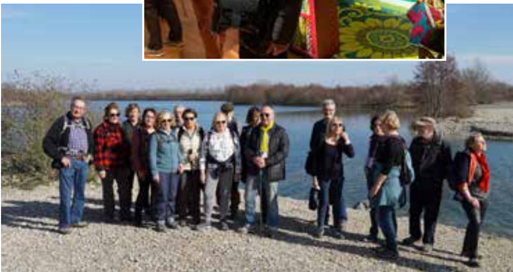
▲ Rando Les Dombes