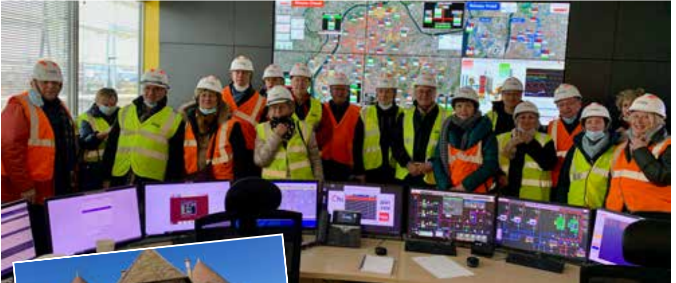
▲ Visite du site de chauffage urbain Biomasse de Gerland