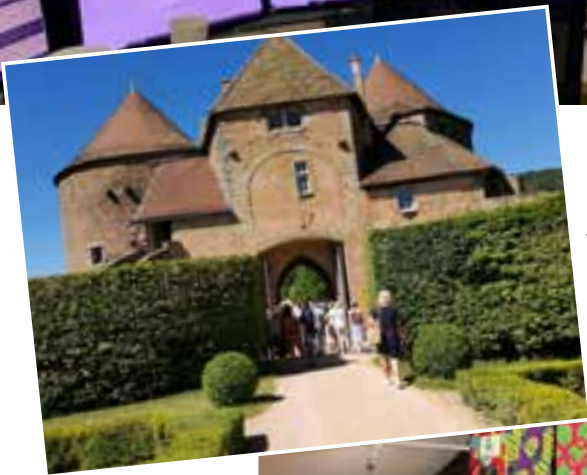
◀ Sortie sur les pas de Larmartine