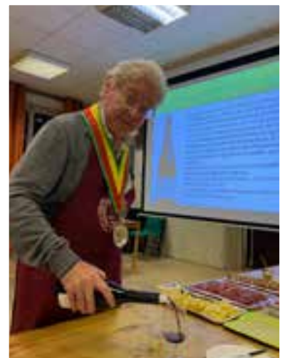
▲ Soirée dégustation Côtes de Beaune