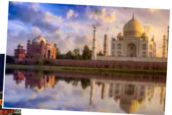
Soirée Rajasthan ▲