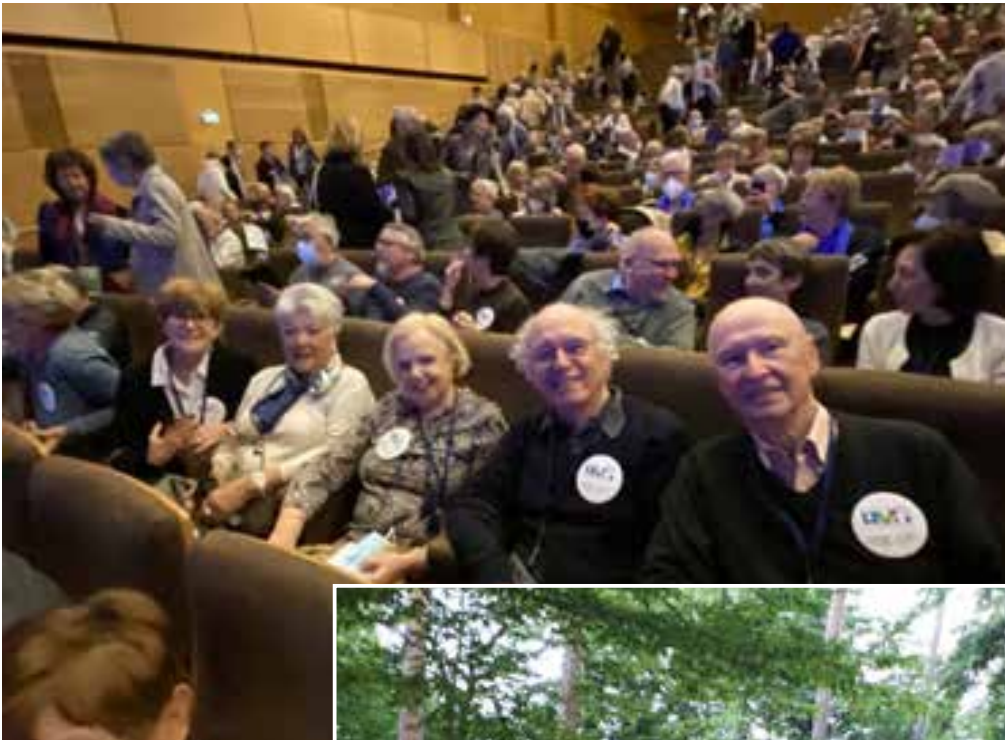
◀ Congrès National AVF Nantes