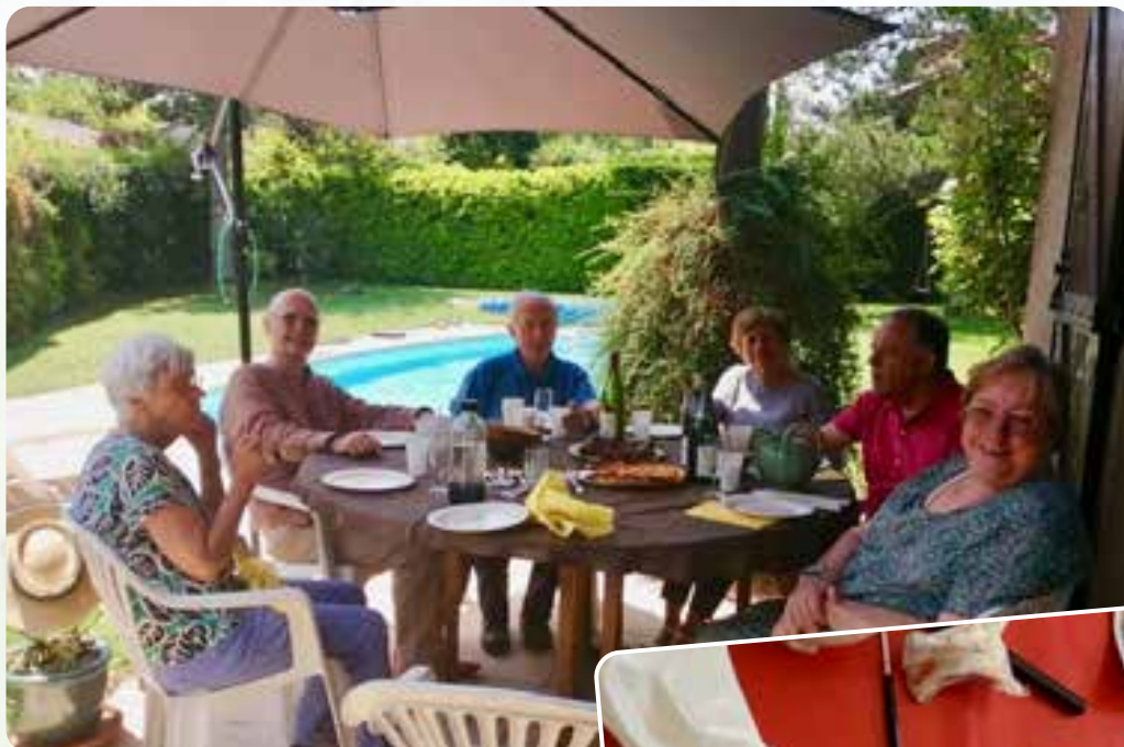
▲ Atelier Aquarelle en plein air.