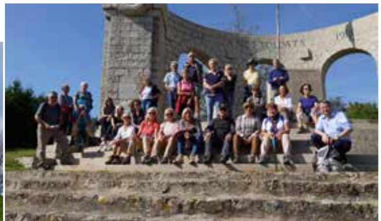
◀ Randos en Beaujolais ▲