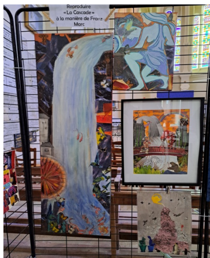
Représentation d'une cascade