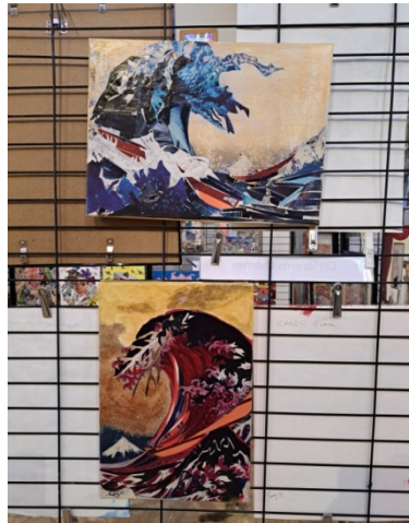
Reproduction de la vague d'Hokusai