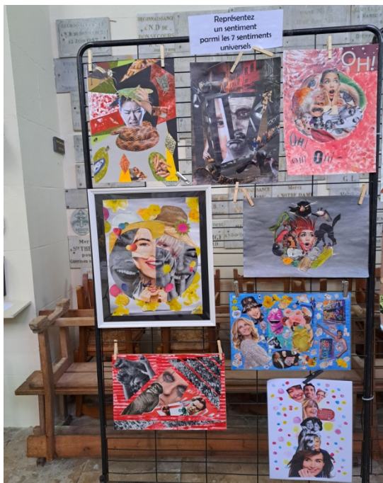
Représentation d'un sentiment