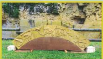
Arche de la future salle

Site classé "Espace naturel sensible" pour sa faune (chauve-souris) et sa flore (orchidées,...)