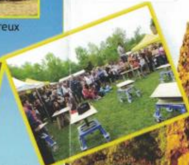
Fête de la pierre

Site classé "Espace naturel sensible" pour sa faune (chauve-souris) et sa flore (orchidées,...)