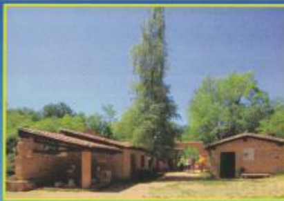
Hameau des pierreux

Conception: Association "Les Carrières de GLAX"