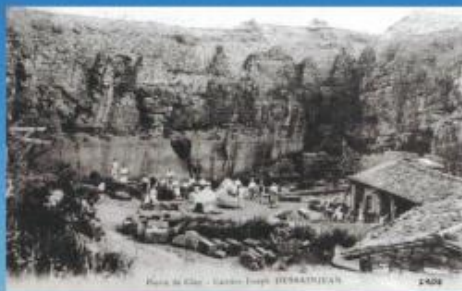
Plan de Glax - Carte Topog. DEBARTHENAY 1898

Mise en valeur du site 'Les Carrières de GLAY' pour faire connaître l'histoire de ce patrimoine.