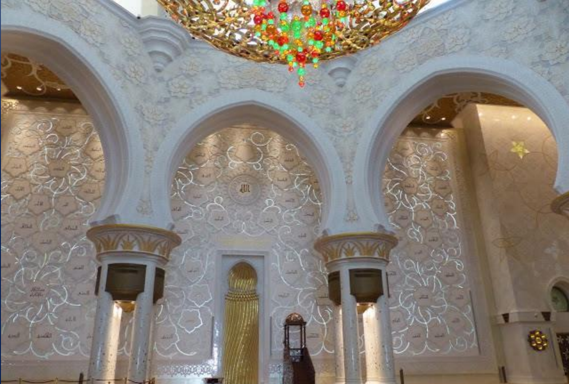
Le mur de Qibla (un mur de prière) comporte les 99 noms de Dieu (Allah) dans la calligraphie traditionnelle de Kufic.