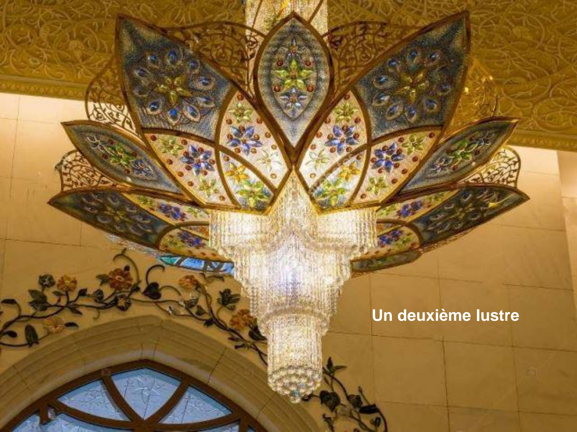
Un deuxième lustre