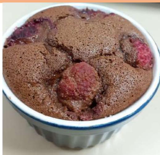
Cari de poulet Réunionnais et soufflé Chocolat Framboise