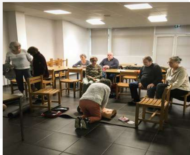
Mise en pratique