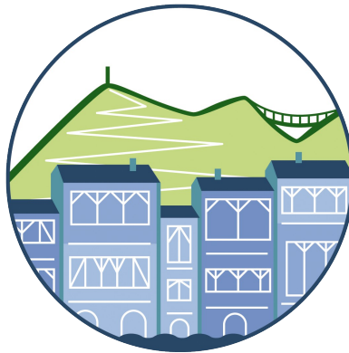
Office de Tourisme de Castres-Mazamet