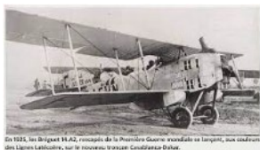
En 1916, les Bréguet 14A2, remaniés de la Première Guerre mondiale en biplans, sont utilisés des Lignes Laskouère, sur le nouveau tracé Casablanca Oujda.