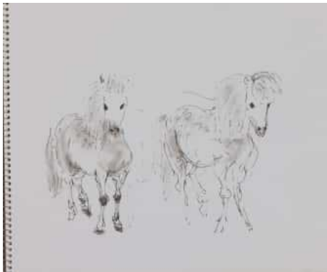
Deux poneys (dessin – encre et lavis)