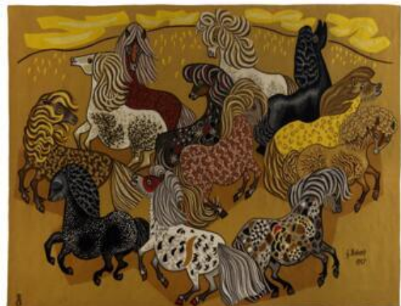
Vent d'Ouest (tapisserie)

En 1941, de passage à En Calcat, Jean Lurçat découvre les aquarelles de Dom Robert et l'entraîne à Aubusson et le convainc de la beauté des tapisseries et Dom Robert fera son premier carton.