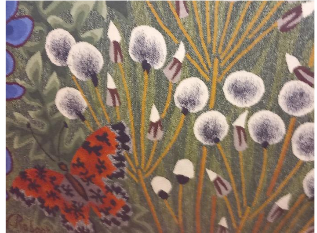
Juin (tapisserie) détail les pissenlits

Nous pouvons voir aussi quelques cartons où les couleurs sont numérotées sur les sujets, étonnants de précision – quelques dessins superbes.