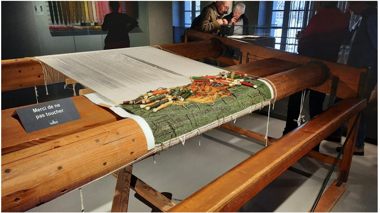
Métier de basse lisse (le lissier va réussir à « traduire en laine » l'intention de l'artiste).