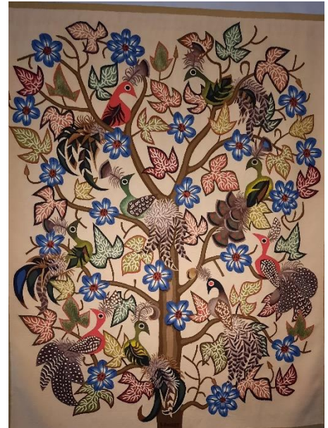
L'arbre d'émail (tapisserie)