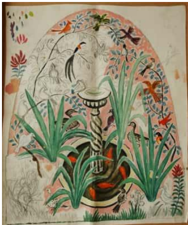
Fontaine de vie (aquarelle)

Nous pouvons voir aussi quelques cartons où les couleurs sont numérotées sur les sujets, étonnants de précision – quelques dessins superbes.