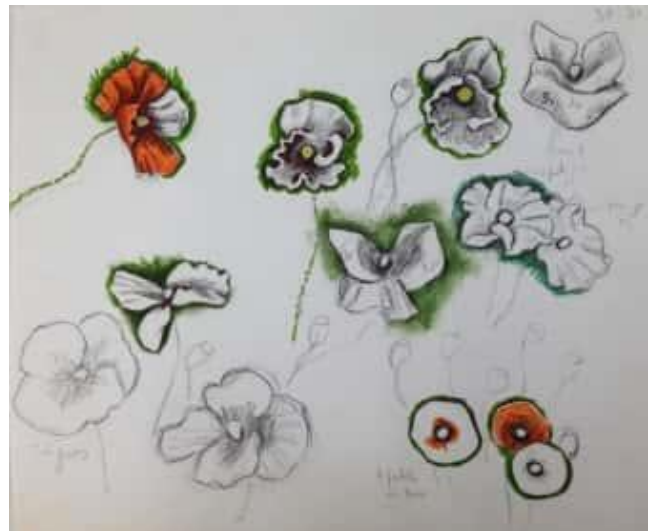
Coquelicots (dessin – fusain et mine de plomb)